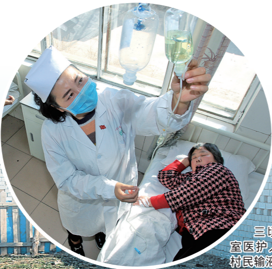
三顷地村卫生室医护人员正在为村民输液。