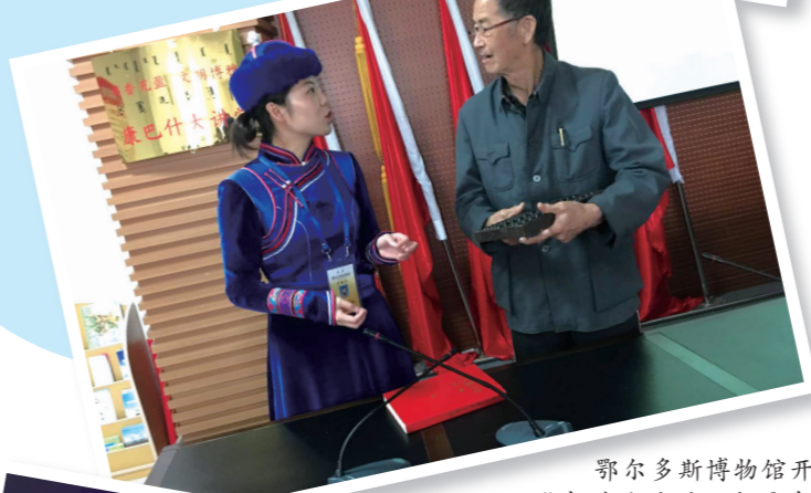
鄂尔多斯博物馆开展“走进十九大 共圆中国梦”文化宣讲活动。