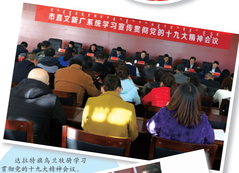
达拉特旗乌兰牧骑学习宣传贯彻党的十九大精神会议。