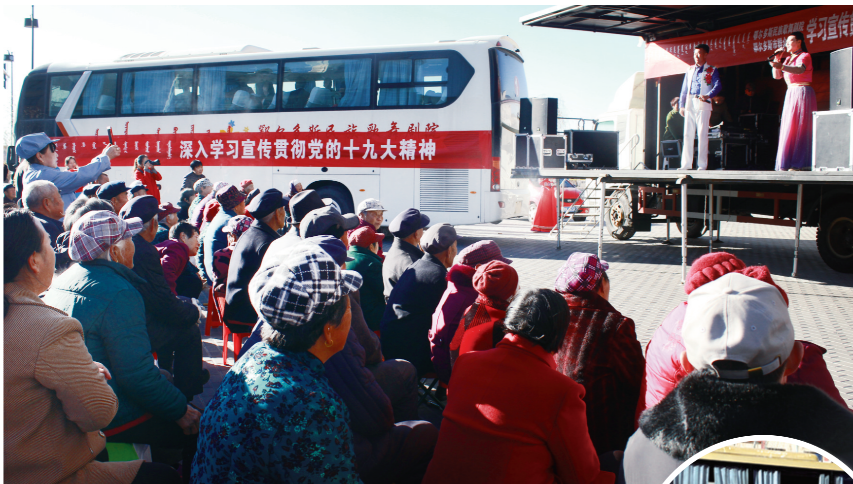
用艺术解读十九大精神。