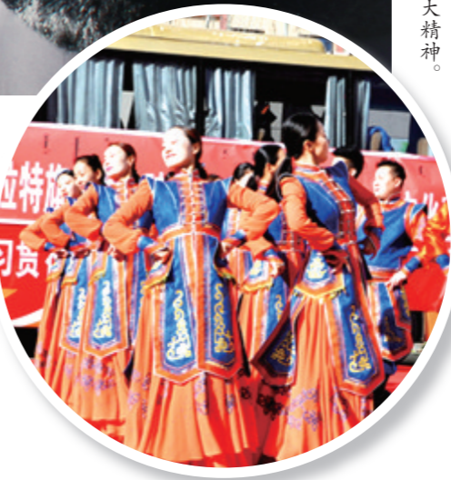
文艺“天天演”深入基层演出。