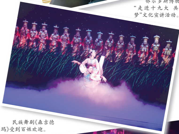
民族舞剧《森吉德玛》受到百姓欢迎。