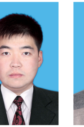
吴江 中国联合网络通信有限公司包头市分公司 全区电信机务员(网络优化)比赛第一名