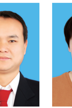
塔林夫 通辽职业学院 全区高等院校青年教师教学理科专科组比赛第一名