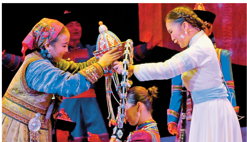
本组图片为《天边》剧照。

文化是旅游的灵魂,旅游是文化的载体,文化与旅游的融合,意义就在于通过旅游实现感知、了解、体察人类文化具体内容。乌兰托娅说,民族歌舞剧《天边》的华丽绽放,也使呼伦贝尔民族歌舞艺术瑰宝永久绽放于世界民族文化艺术之园。