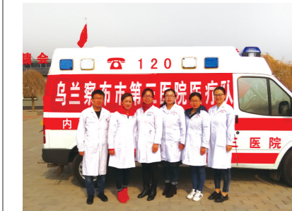
医院医疗专家组常态化的下乡扶贫义诊。