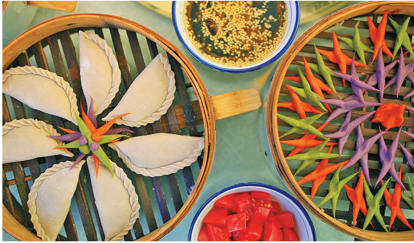
上桌的莜面精致如艺术品。