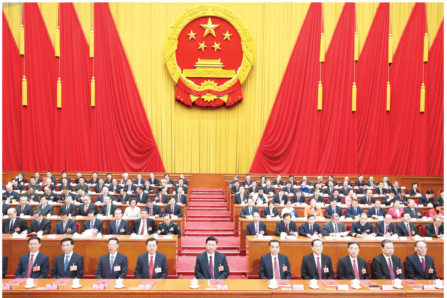
3月20日,第十三届全国人民代表大会第一次会议在北京人民大会堂闭幕。习近平等党和国家领导人在主席台就座。

新华社北京3月20日电 中华人民共和国第十三届全国人民代表大会第一次会议,在圆满完成各项议程,产生新一届国家机构组成人员后,20日上午在人民大会堂闭幕。