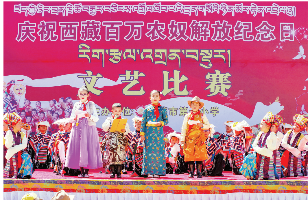
西藏小学 庆祝 3 28 纪念日

3月28日,拉萨市第一小学举行庆祝百万农奴解放纪念日文艺比赛。当日,拉萨市第一小学举行文艺比赛活动,载歌载舞庆祝西藏百万农奴解放纪念日。