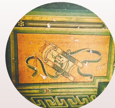
古民居里的炕围画。