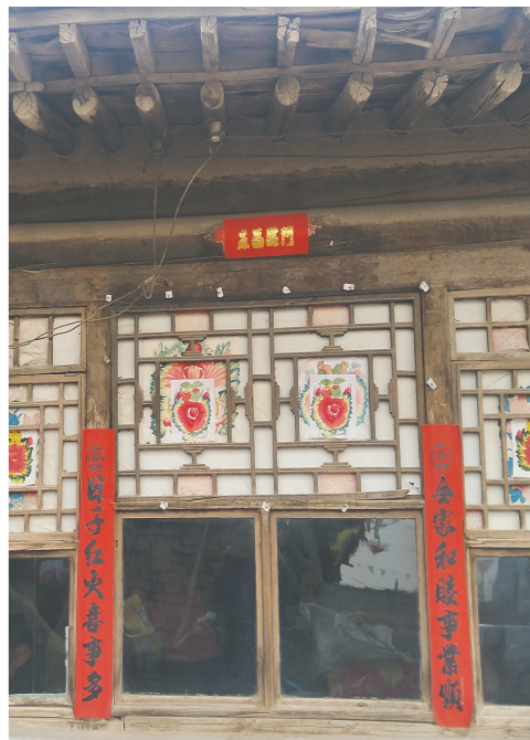
王家老宅已有300余年历史。