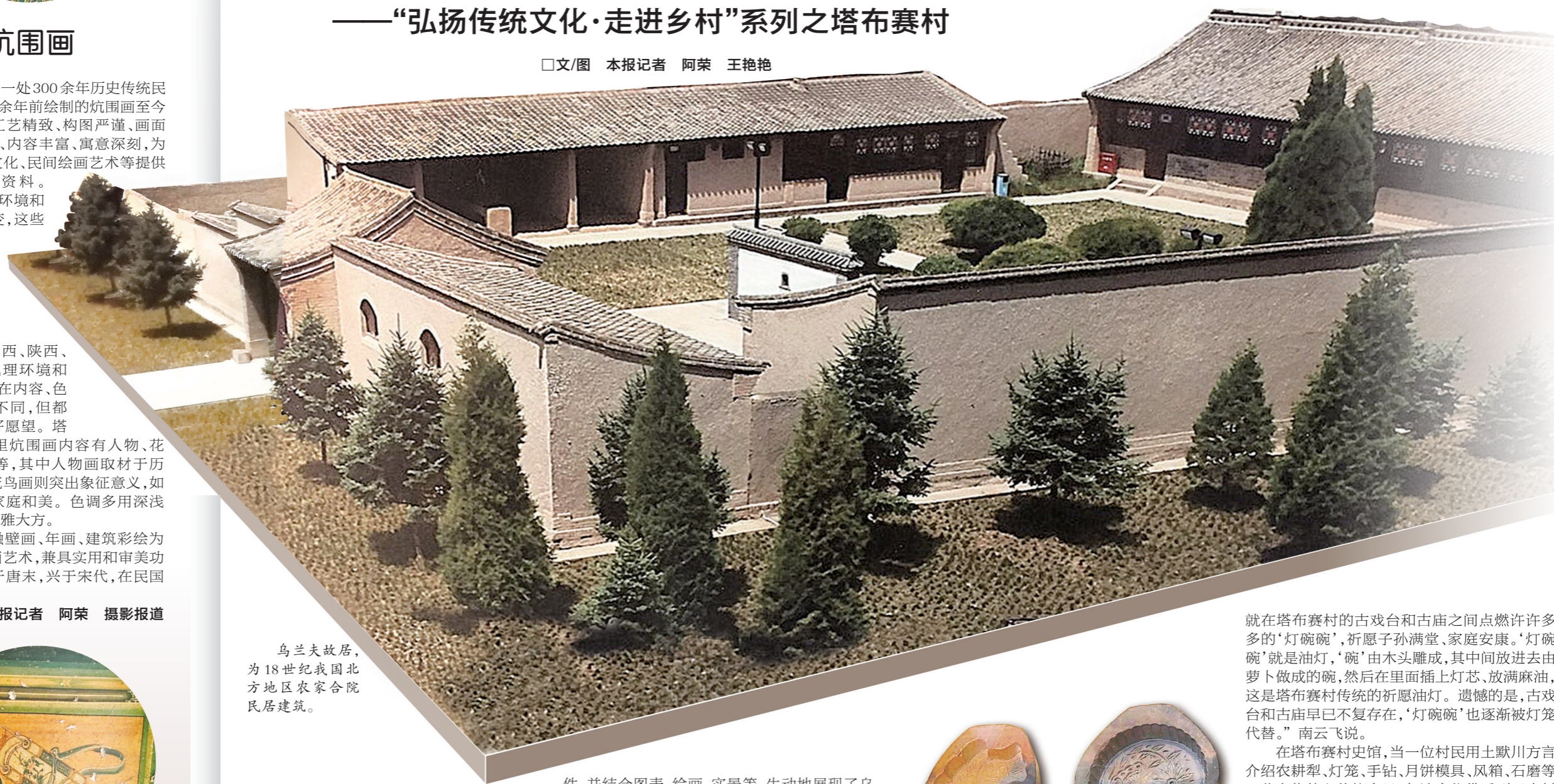
乌兰夫故居,为18世纪我国北方地区农家合院民居建筑。