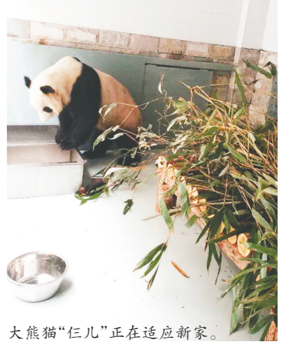
大熊猫“仨儿”正在适应新家。