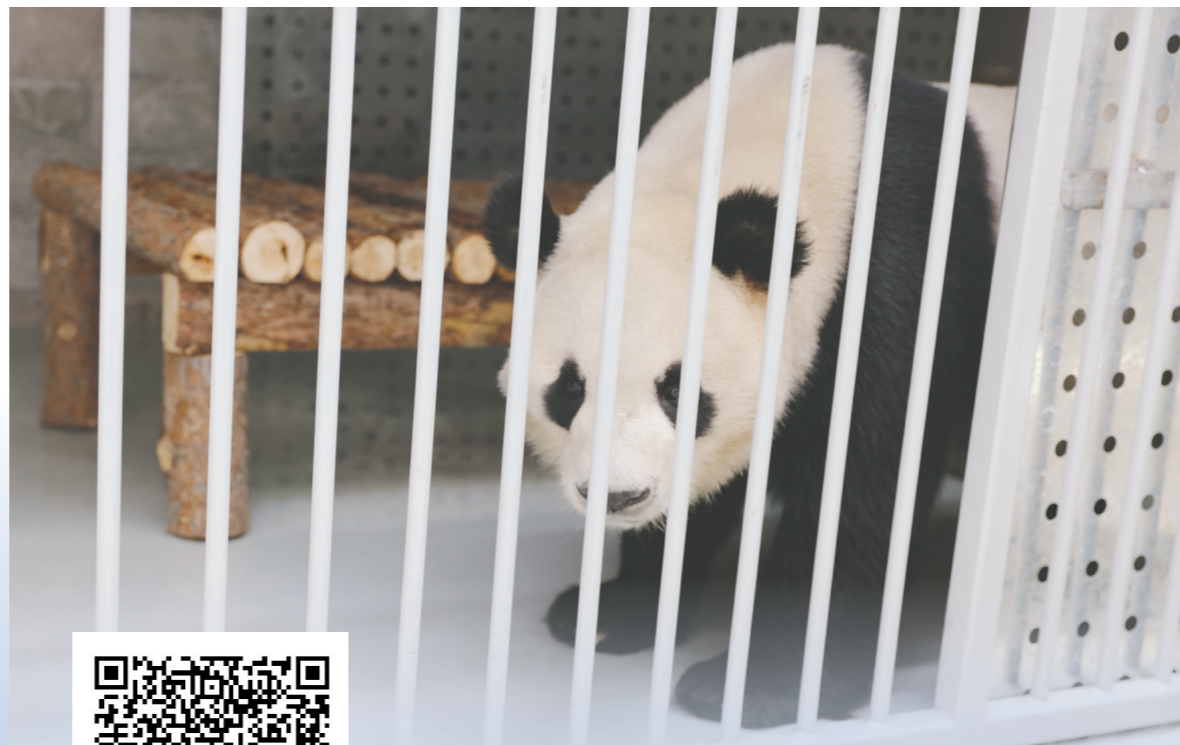
大熊猫“茜茜”刚到新家比较害羞。