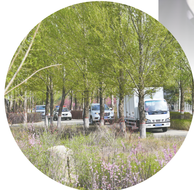
车队护送国宝入园。

据了解,在成都大熊猫繁育研究基地派遣动管部技术人员协助下,大熊猫姐妹将在一段时间的隔离适应期后和市民见面。