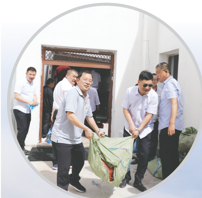
工作人员准备竹子。