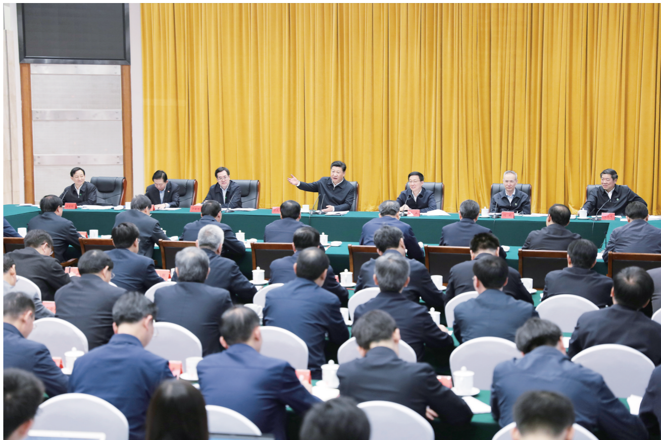
4月26日下午,中共中央总书记、国家主席、中央军委主席习近平在武汉主持召开深入推动长江经济带发展座谈会并发表重要讲话。

新华社武汉4月26日电 中共中央总书记、国家主席、中央军委主席习近平26日下午在武汉主持召开深入推动长江经济带发展座谈会并发表重要讲话。他强调,推动长江经济带发展是党中央作出的重大决策,是关系国家发展全局的重大战略。新形势下推动长江经济带发展,关键是要正确把握整体推进和重点突破、生态环境保护和经济发展、总体谋划和久久为功、破除旧动能和培育新动能、自我发展和协同发展的关系,坚持新发展理念,坚持稳中求进工作总基调,坚持共抓大保护、不搞大开发,加强改革创新、战略统筹、规划引导,以长江经济带发展推动经济高质量发展。