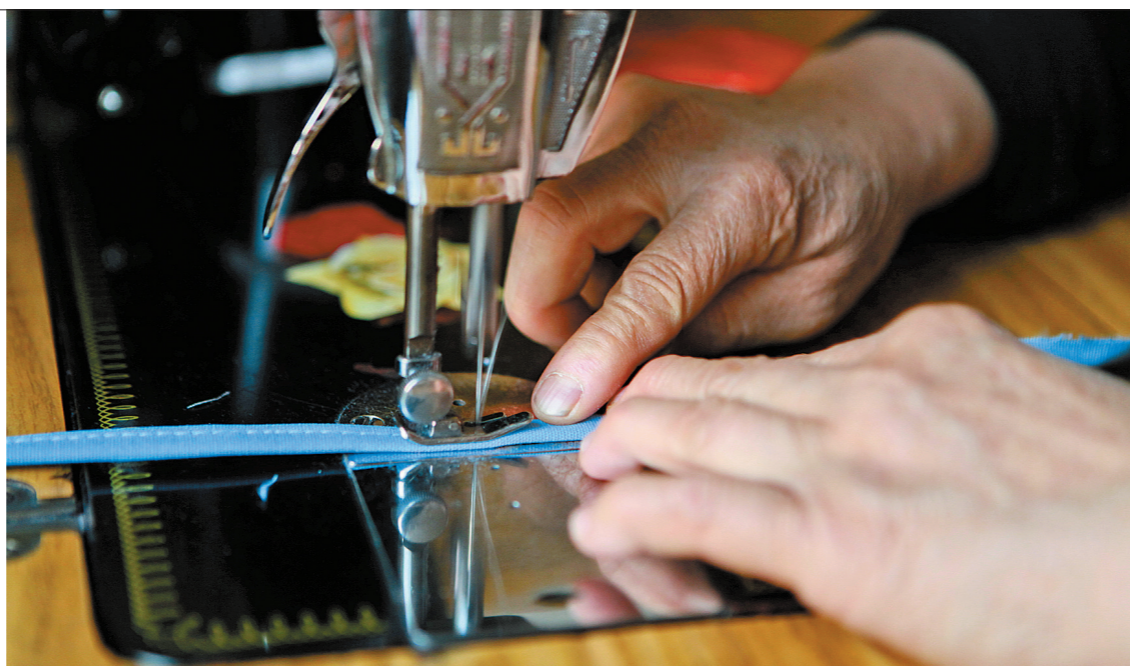
仍离不开裁缝灵巧的双手