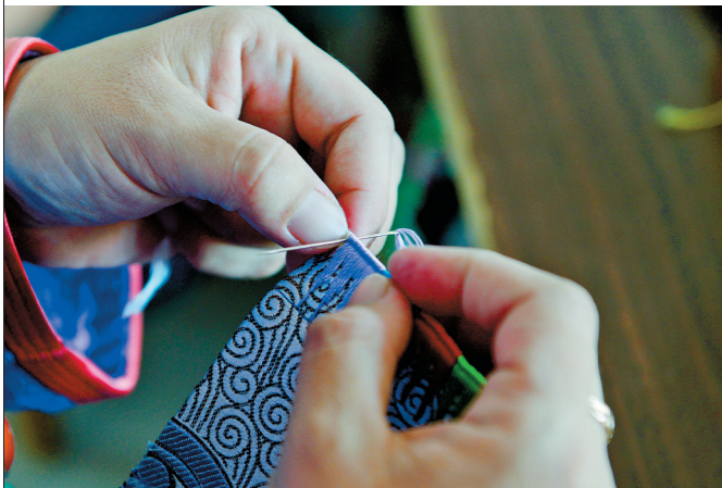
锡林郭勒盟苏尼特左旗蒙古族刺绣传承人乌云其木格，用双手一针一针绣出精美的图案。 本报记者 王晓博 摄