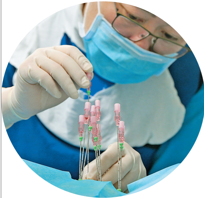
内蒙古自治区肿瘤医院微创介入科医生在给患者进行手术，他的手意味着生命与希望。

工人、医生、农民、教师 一双双劳动者的手，无论灵巧与笨拙，无论粗糙与纤细，都在不同岗位上创造社会财富、传递人间温暖、播种人类希望。