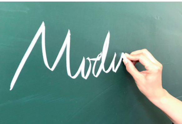
北京四中呼和浩特分校的英语老师王颖，用写了无数个粉笔字的手，帮助学生们圆了美丽的梦。 本报记者 孟和朝鲁 摄