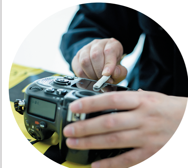
庄云龙是一名相机维修师，每一部相机在他手里都容不得一粒灰尘。