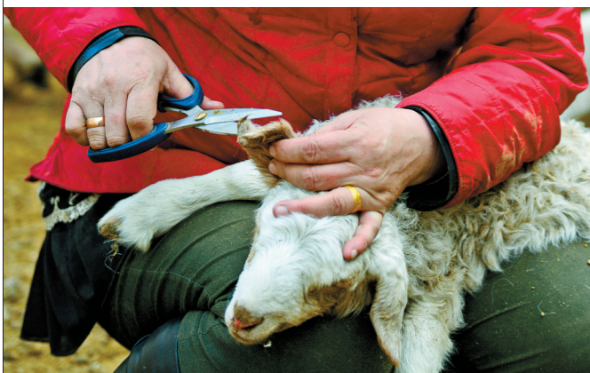
鄂温克族牧民给羊羔打耳标，勤劳的双手让她家的日子越来越好。