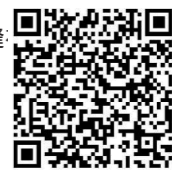
新闻连连看 扫一扫，看H5