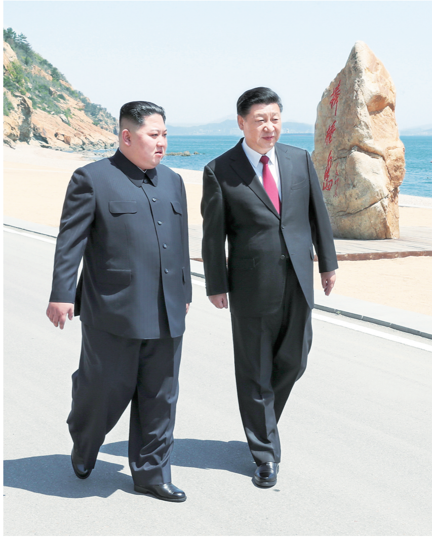
5月7日至8日,中共中央总书记、国家主席习近平同朝鲜劳动党委员长、国务委员会委员长金正恩在大连举行会晤。