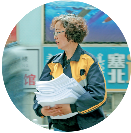
送报也需要个好体力。

正是这种严谨负责,成就了信传千里的“小白鸽”。最近5年,她们准确投递电报42万余份,准确送达国际联运电报3千多页。在千里铁道线上空,她们以独有姿态傲然飞翔。