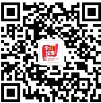
学习论理微信二维码