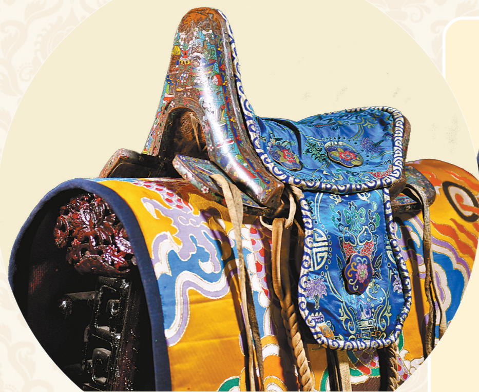
【柏丝珐琅大包公主鞍】