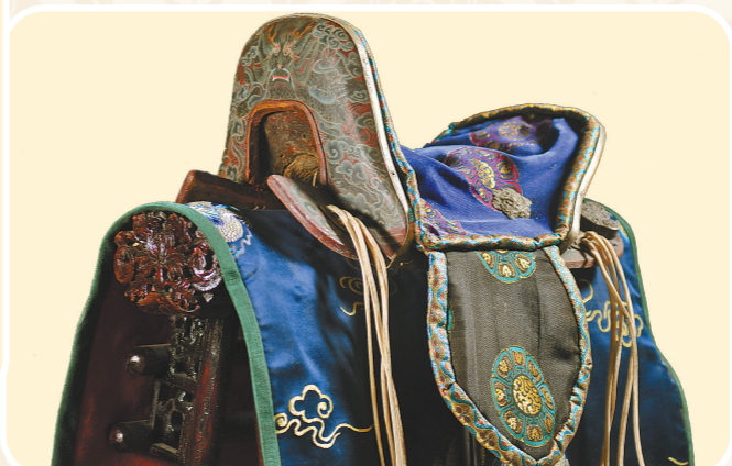
【彩绘(整木雕)大官座】

蒙古族爱马、饰马,以拥有骏马雕鞍为荣。他们用昂贵的材料制作马鞍,通过精美的图案表达平安与吉祥的愿望。