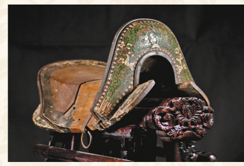
【螺钿镶嵌牛角骨官鞍】