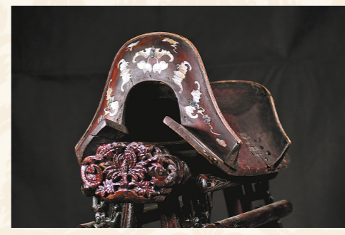
【螺钿镶嵌红木官鞍】