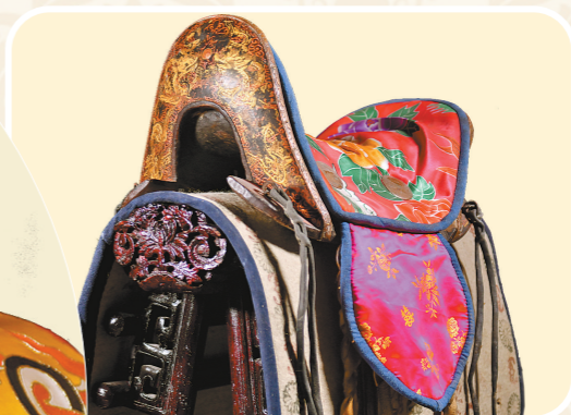
【柏木彩绘双龙戏珠走马鞍】