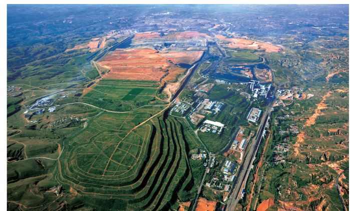
黑岱沟露天煤矿北排土场回建的万亩绿化灌木。

五是通过了与荒漠化和土地退化防治密切相关的干旱政策倡议、沙尘暴政策框架倡议。据了解,《联合国防治荒漠化公约》第十三次缔约方大会期间,中国作为东道国,还启动了“一带一路”防治荒漠化合作机制,召开了全球防治荒漠化青年论坛和中国科技治沙、防治荒漠化、民间组织在行动、防沙治沙与精准扶贫等多个边会,举办了防治荒漠化成就展、现场考察、纪念植树等活动。鄂尔多斯生态治理成为“中国经验”走向世界。