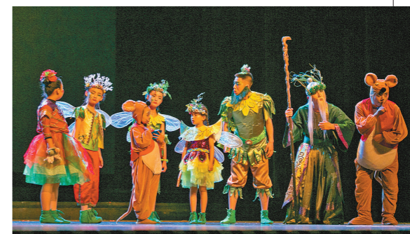
儿童动漫舞台剧《草精灵之草原之心》。