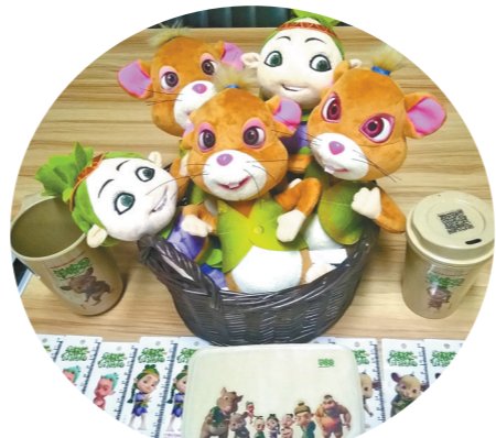
《草精灵》动漫衍生产品。本报记者 徐跃 摄