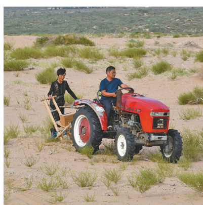
白音道尔计和妻子在自家承包的沙地里种植柠条。