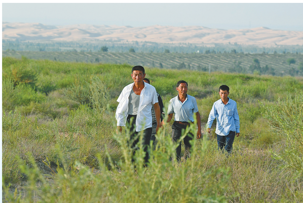
杭锦旗官井村第二代治沙人。