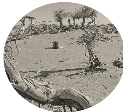
二十多年前的库布其生态环境十分恶劣。

一份眷恋，一种担当；库布其人对绿色的追逐，坚韧不拔、百折不挠。 历史上的每一个时期，伊克昭盟（今鄂尔多斯市）都会出台关于治沙造林、生态建设的相关政策和规定； 参与治沙的每一个企业，几乎都有着在挫折中逆转、从困境中突围的经历； 坚守在治沙一线的每一户牧民，都有着代代相传的绿色情结，都有着人进沙退的勇气和决心！ 今天，当库布其已经绿染黄沙，百折不挠的库布其人初心不改、再启征程。大漠深处，绿色一定会更加张扬、更加奔涌！