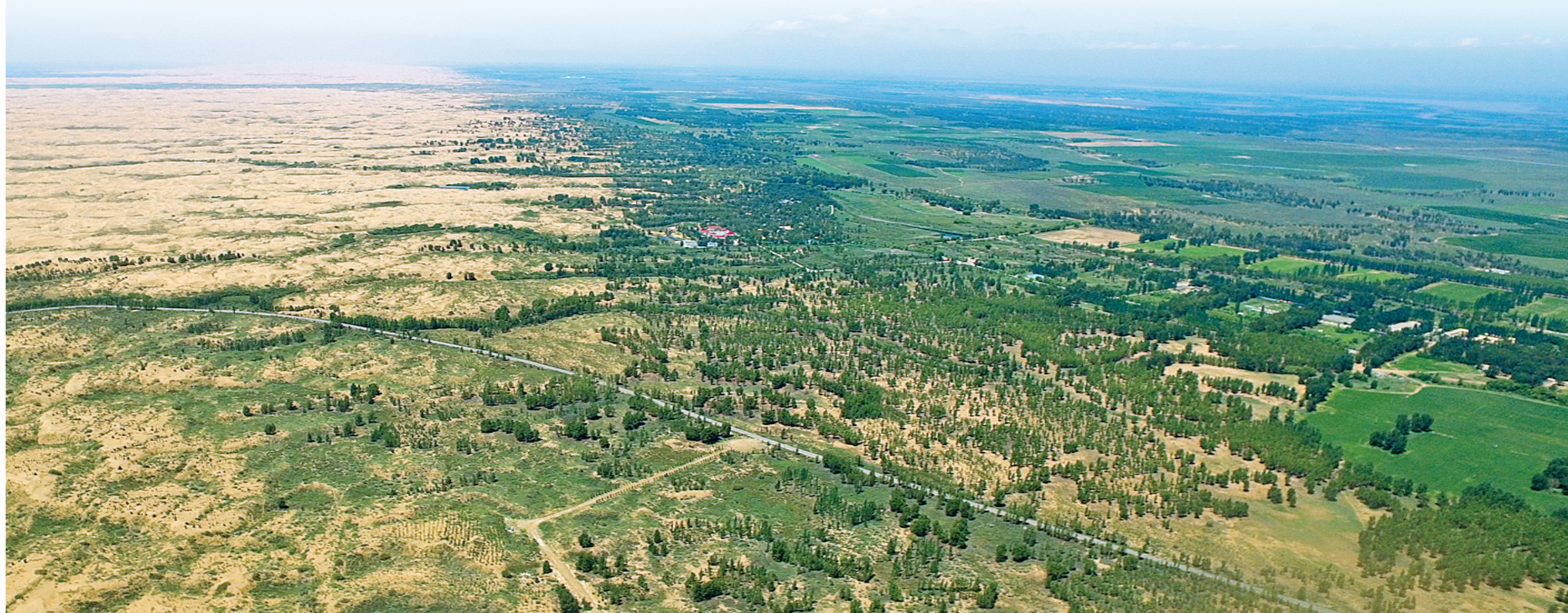
绿洲正在逐步向沙漠腹地推进。