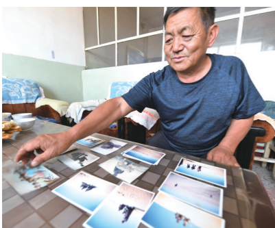
白音道尔计翻看过去治沙时拍的老照片，感触颇多。