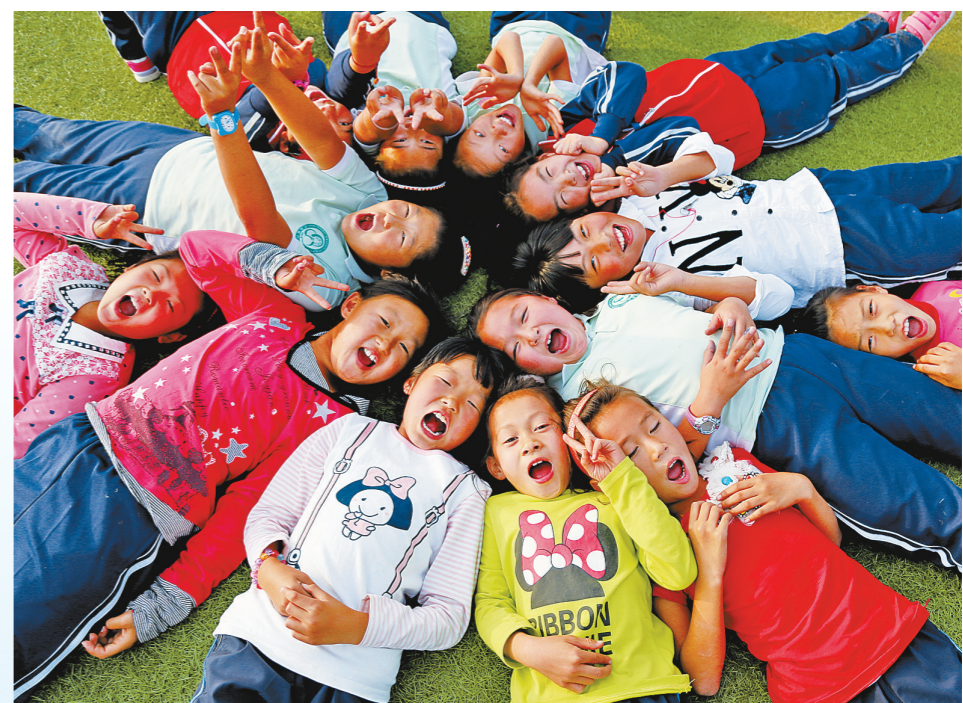
沙漠里的孩子上学不再难。