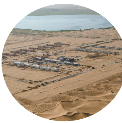
初建时的亿利新村。