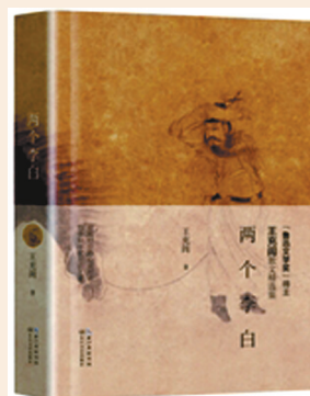
出版者：王充闾 长江文艺出版社

李白》一书中，通过对人物命运的透彻分析，以期达到叩问历史秘密的，并不在少数。如《情在不能醒》《马嵬坡下的三场辩论》《李师师的真爱》《欲望的神话》《灵魂的拷问》等等篇目，都有这样的深度剖析。这些散文从人物命运的角度切入，进而折射当时历史、社会、经济等各方面的景况，把人物置身于当时的历史场景中，隐藏的秘密就渐渐清晰，渐渐明朗。点点滴滴的浸润，起到了润物细无声的作用，让人们通过对历史人物的缅怀，得到智慧的启迪，进而把握住人生的缰绳，书写自己的精彩。