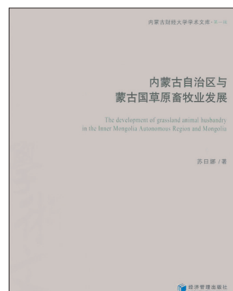
出版者：苏日娜 经济管理出版社

新方法。本书以定性研究为主，但并不排斥运用计量经济学模型这种定量研究的方法。比如在研究牧户生产决策行为时，选取logistic模型对影响牧民生产行为因素进行实证分析。在对内蒙古畜产品流通效率的实证分析时，进行了KMO和Bartlett的球形度检验和成份矩阵的分析方法。在对牧户生产意愿实证分析时，通过SPSS软件对172个有效牧户样本数据进行logistic回归处理。更加可贵的是，许多结论来自于这些定量研究的方法。这就大大增加了这本专著的科学性。