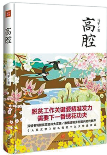
作者：马平 出版社：天地出版社