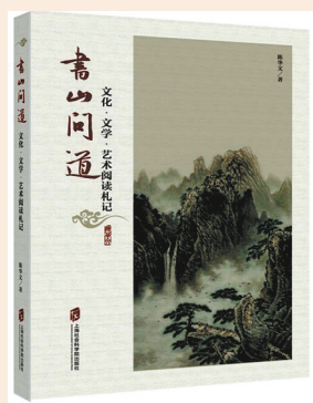
出版者：陈华文 上海社会科学院出版社

作者指出：真正的好书评，既立足于书，又不拘泥于书，重要的是阐发其独立的思想见解，这是知识生产的第二次创新。读完本书，带来这样的启示：阅读是一个无边无际的海洋，只要凭着阅读的兴趣坚持下去，勇敢走下去，一个绚烂的精神世界，就会明晃晃呈现于眼前。