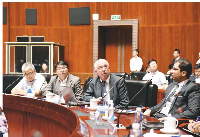
专家学者在能源大会分论坛讨论。