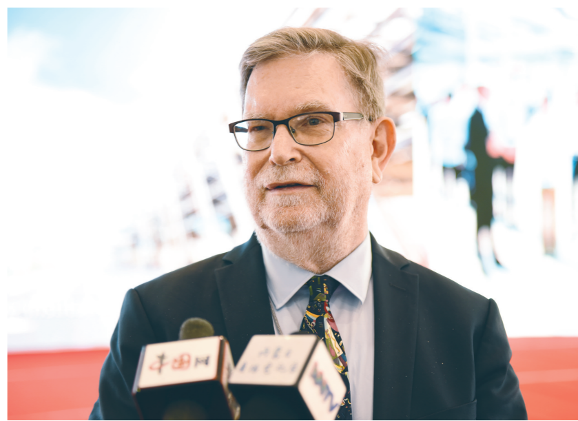
诺贝尔物理学奖获得者乔治·菲茨杰拉德·斯穆特接受媒体采访。