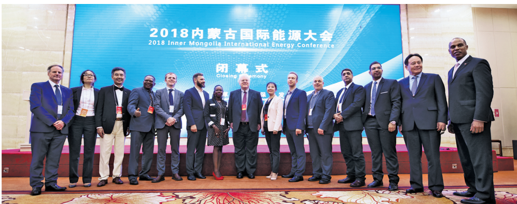
国内外专家学者在闭幕式上合影留念。