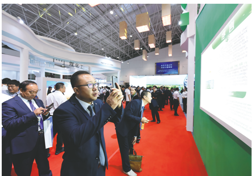
嘉宾参观改革开放40年内蒙古能源成就展。