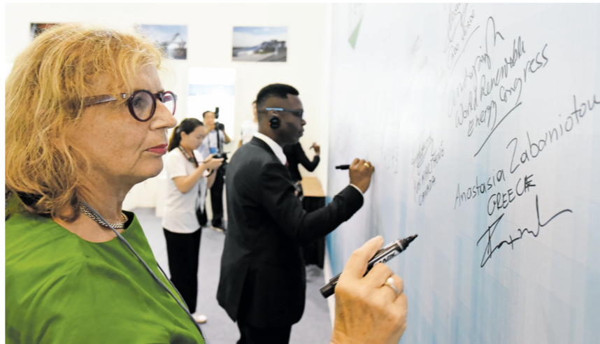
学者专家在改革开放40年内蒙古能源成就展签名墙上签名。

据介绍,本次大会成果丰硕:深化了对能源资源重要性的认识,探讨了未来能源经济发展和趋势,针对存在的政策、技术、制度和难题提出了解决方案;针对内蒙古现代能源经济发展提出了建设性和可操作性建议、意见,搭建了内蒙古能源合作交流高端平台和专业化服务平台;签约了一系列能源领域合作项目。