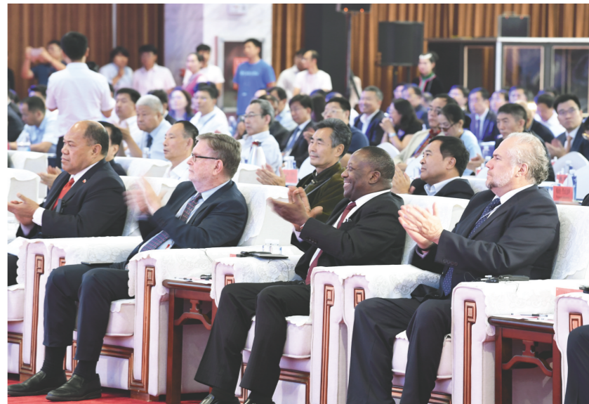
“诺奖”智慧分享环节赢得阵阵掌声。