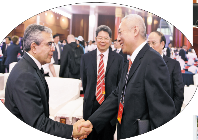
国内外专家学者进行交流。

主办: 内蒙古草原文化保护发展基金会 Hosted by Inner Mongolia Grassland Culture Protection and Development Foundation 承办: 鄂尔多斯市人民政府 Supported by the Ordos Municipal People's Government