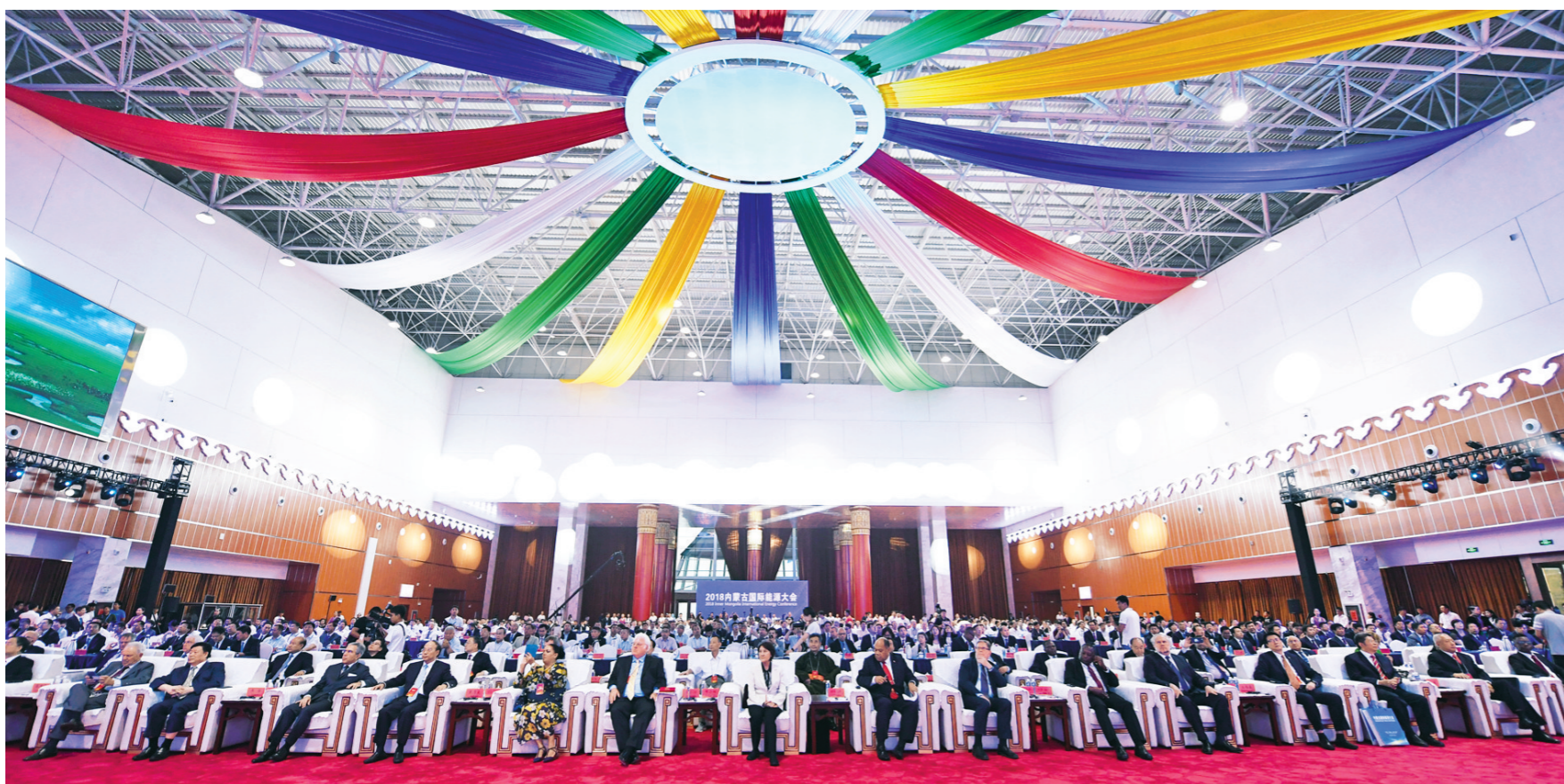
内蒙古国际能源大会全体会议现场。