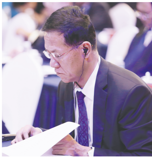
认真阅读大会相关资料。