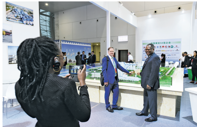
与会嘉宾在能源成就展合影留念。