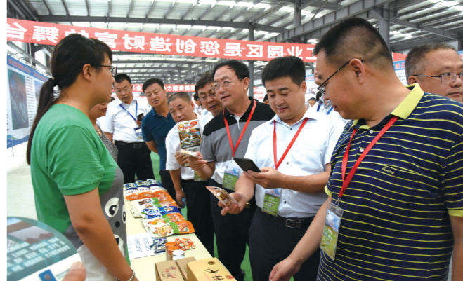
赤峰峰会与会人员参观松山区安庆工业园区。

水是家乡美,月是故乡明,乡愁牵动着每一位游子的心弦,即使走到天涯海角,也割舍不掉这片生于斯、长于斯土地的深深眷恋。如今,乡情和友情激发出赤峰乡友报效家乡的澎湃动力。我们相信在今后的日子里,天南地北的乡友们,会更加积极地参与到家乡发展建设中,在带回梦想、荣耀家乡的实践中,实现更大的作为。