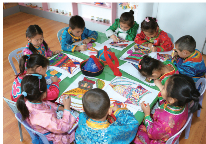
赤峰市是全区基础教育质量和均衡发展水平最高的市。图为赤峰市蒙古族小学的孩子们在做手工艺品。

优化软环境,改善硬环境。总规划占地129平方公里的赤峰高新技术产业开发区,是赤峰市的东部工业经济走廊。为了实现全市产业集中、集约、集聚发展,市里制定了“飞地经济”政策,鼓励和支持全市各旗县非资源性工业项目,包括招商引投资项目,到赤峰高新区落地实施。飞地经济政策明确,企业注册、税务登记在旗县(飞地)办理,立项、环评、安评、规划选址、配套服务等由赤峰高新区(飞入地)负责。目前,园区的工业土地价格较低,每亩10万元左右;马林园区规划建设的自备热电联产项目一期建成后,年发电49亿度,电价预计每千瓦时0.40元。眼下,园区赤峰云铜40万吨铜冶炼项目和赤峰金剑40万吨铜冶炼等一批项目建设正如火如荼,园区也将进入国家级园区行列,它将为赤峰的跨越崛起,挺起工业的脊梁。