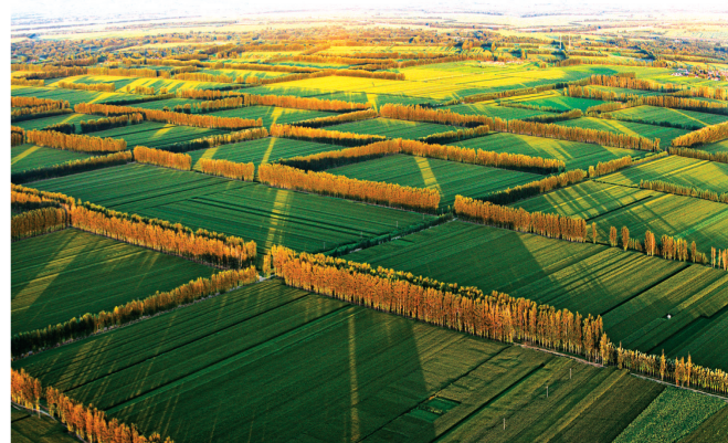
赤峰市是全区生态建设获得荣誉最多的市。图为太平地农田防护林网。