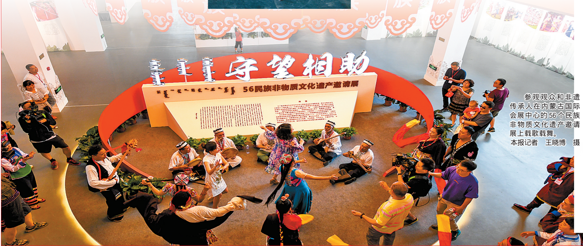
参观观众和非遗传承人在内蒙古国际会展中心的56个民族非物质文化遗产邀请展上载歌载舞。