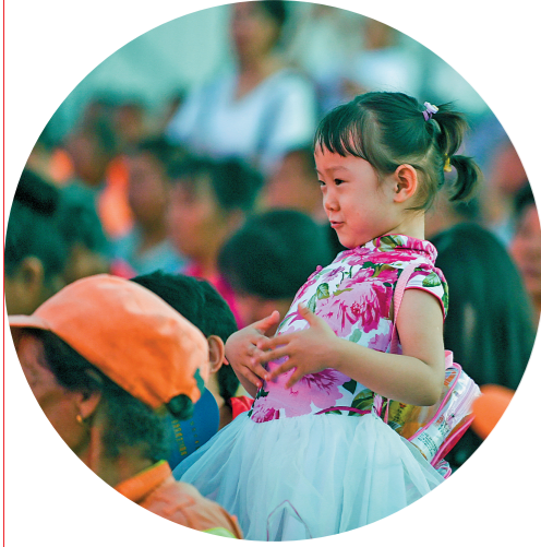
一名小观众在如意广场观看并模仿全区首届农牧民文艺节目展演中的舞蹈表演。

艺人的匠心之作,观众用心感知。本届草原文化节深入贯彻落实习近平总书记系列重要指示精神,坚持精品展示与文化惠民并重,一大批有筋骨、有道德、有温度的匠心之作让艺术之花夺目绽放,推动着自治区文化大发展大繁荣、为打造祖国北疆亮丽风景线、守好各民族共有精神家园作出新的贡献。