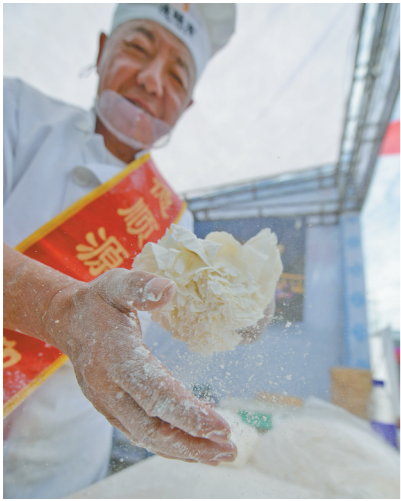
美食节上,娴熟的包烧卖手法让人眼花缭乱。