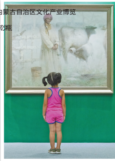
在第三届内蒙古自治区文化产业博览会上,台前演员默默沉浸在舞台草原画派馆,小朋友在美术作品前看的入神。