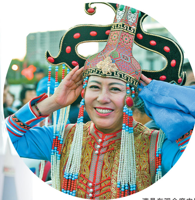
演员在观众席中展示精美民族服装和美丽笑容。