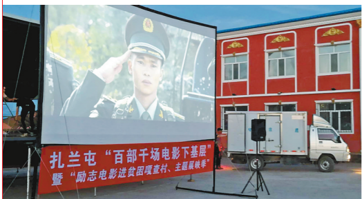
乌兰牧骑励志电影展映走进扎兰屯市铁东街道办事处。