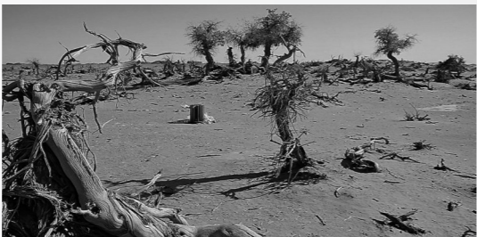
二十多年前的库布其生态环境十分恶劣。(资料图)