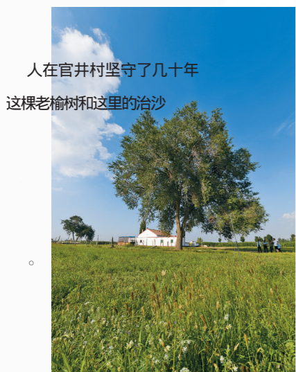
人在官井村坚守了几十年,这棵老榆树和这里的治沙。

一株苗,可能是最脆弱的生命,又可能是最坚强的存在;一棵树,可能会经历漫长的孤独,又可能会幻化出一片永恒的林海。一切皆有可能。因为,这里是库布其。一棵树的年轮,记述着30载沙漠变绿洲的奇迹。