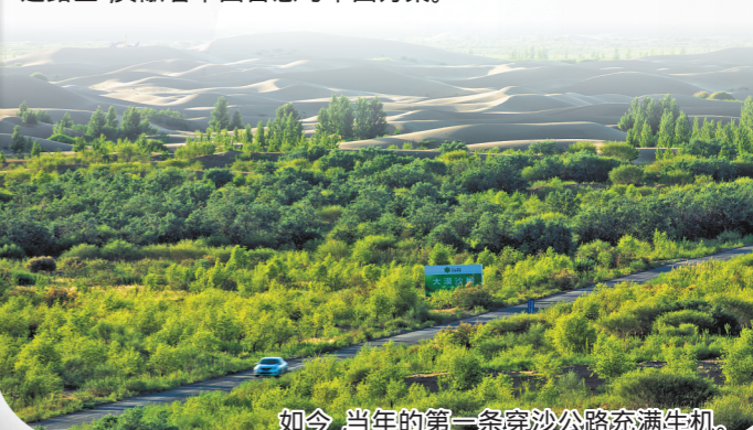
如今,当年的第一条穿沙公路充满生机。