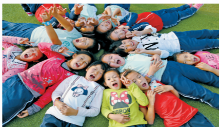
福的梁路上洋溢着幸福,沙漠变绿洲,孩子。

生死存亡,离去,是个并不艰难的决定,坚守,却往往需要巨大的勇气。风沙肆虐,这里的人们不仅选择了执拗的坚守,还开启了人类历史上罕见的壮丽逆行。这里,就是库布其。每个库布其人都拥有着关于沙漠的苦涩记忆,除了沙子的黄和天空的蓝,这里毫无绿色的生机。