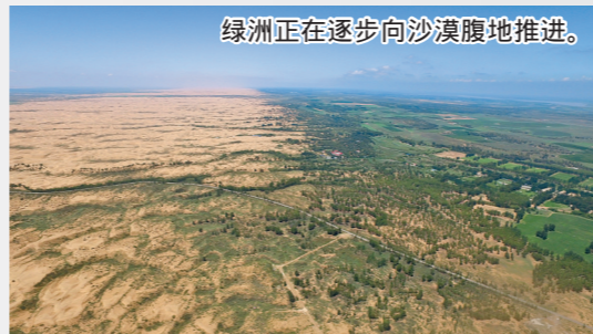
绿洲正在逐步向沙漠腹地推进。