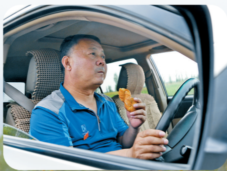
着干粮,饿了就随便吃口。