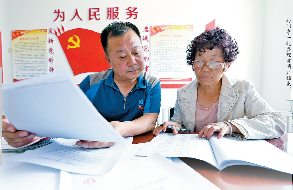
与同事一起整理贫困户档案。