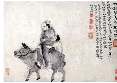
《大涤子自写睡牛图》