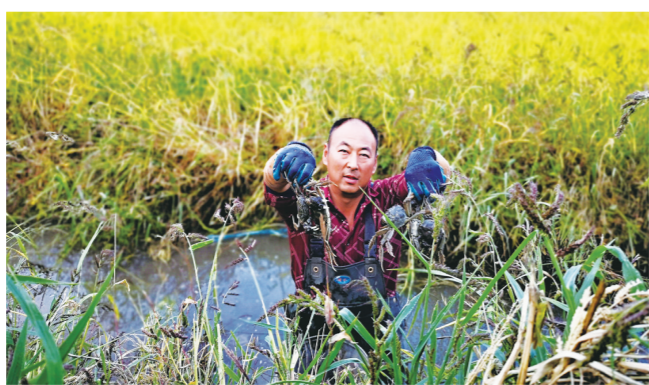
稻蟹共生。