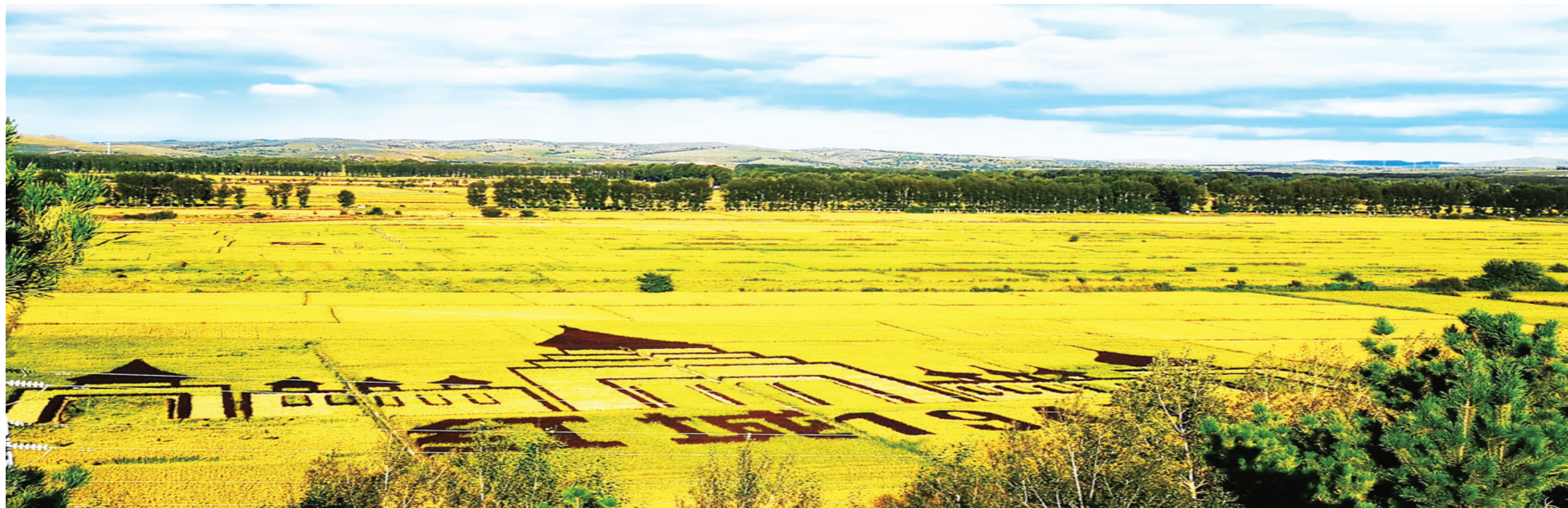
金秋时节 稻谷飘香。