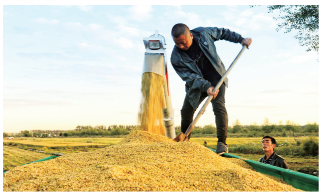
兴安盟大米 丰收啦！