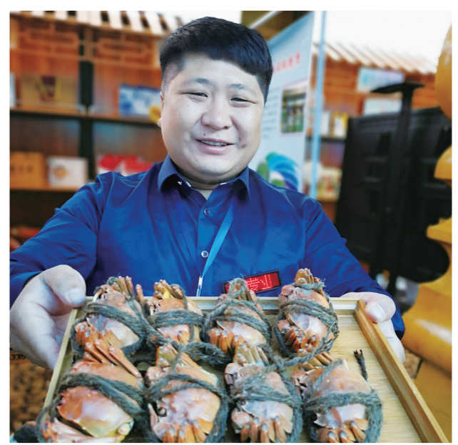
蟹肥稻农乐。

以种、养、加、销为一体的扎赉特旗魏佳米业,从源头上把好投入品质量关,生产过程中进行全程质量监控,在好力保乡水田村通过土地流转200亩,作为有机水稻生产基地,进行立体开发,发展稻田养蟹、养鱼、养鸭140亩,实行基地统一品种、统一栽培、统一管理、统一投入品、统一收货的“五统一”,并打造了魏佳蟹田有机大米品牌,畅销全国各地。