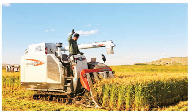
稻谷进入收割期。