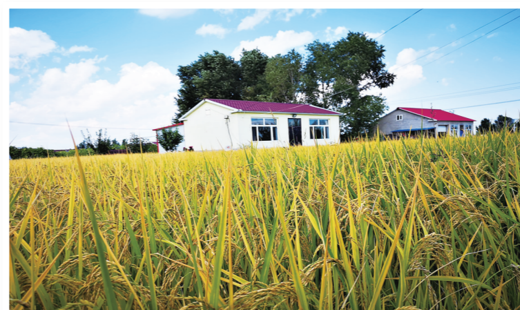
沉甸甸的稻穗压弯了稻秆。

不是所有兴安盟产的大米都能贴上兴安盟大米地标,只有经过质检部门认定并达到三品一标产品标准的兴安盟产的大米才能贴地标。兴安盟农牧业局副局长张福君说,围绕促进产业健康发展,兴安盟将进一步加强规范管理,近期出台兴安盟大米标准,成立由政府、企业共同参与的兴安盟大米产业联盟,共举一杆旗,共打一张牌,合力打造兴安盟大米品牌。