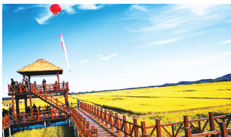
风吹稻浪 满眼金黄。 胡日查 摄