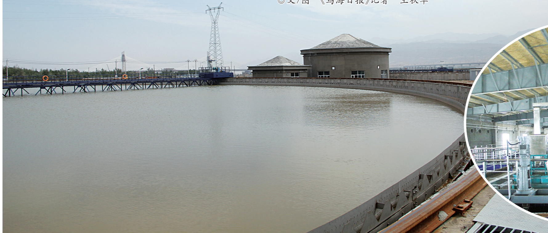
净水厂污水沉淀池。