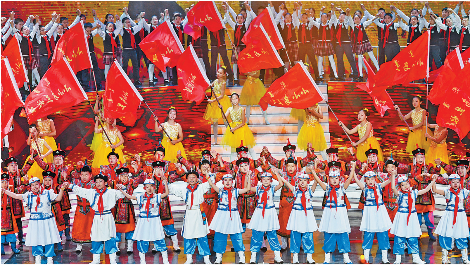
呼和浩特市青少年活动中心小小乌兰牧骑童声合唱团演唱主题歌《我们是小小乌兰牧骑》。