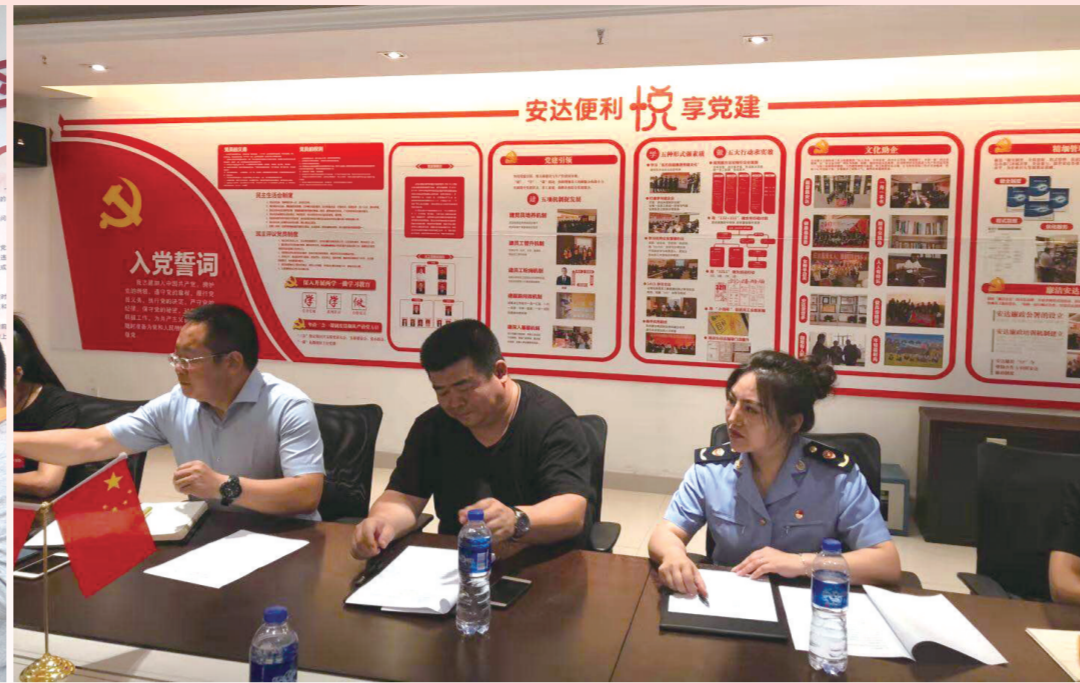
呼和浩特市工商局党建指导员指导非公企业开展党建工作。