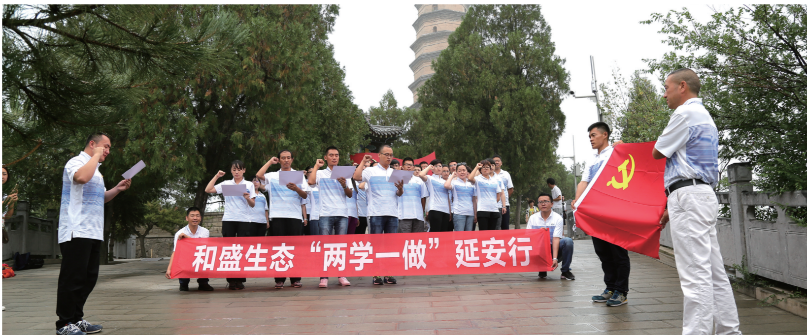
内蒙古和盛生态育林有限公司党总支组织全体党员赴革命圣地延安,重温入党誓词,接受党性教育。

征程万里风正劲,重任千钧再出发。呼和浩特市各级党组织和广大党员不忘初心、牢记使命,推动全市基层党建全面进步,让党的旗帜在自治区首府高高飘扬,为建设亮丽内蒙古、共圆伟大中国梦作出新的贡献。