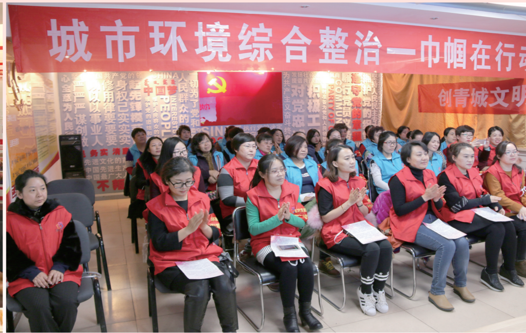
回民区三顺店社区举办“巾帼心向党 共建幸福城”活动。