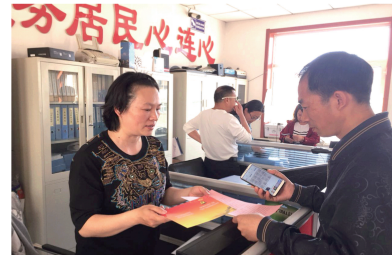
新城区东影北街社区抓实“三化”措施,为换届选举提供坚强保障。