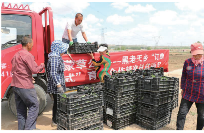
内蒙古蒙草生态环境(集团)股份有限公司在和林格尔县黑老夭乡推广订单种养项目,助力乡村振兴。

武川县以选优配强基层党组织队伍为抓手,深入推进党建促脱贫攻坚工作。一是抓思想政治建设。开展脱贫攻坚专题培训1700人次,选派190余名干部赴北京大学、浙江大学参加专题培训,强化干部思想政治建设,提升帮扶工作能力。二是抓班子建设。选派9名县处级领导干部兼任乡镇党委第一书记,选派2名脱贫攻坚干部担任乡镇脱贫攻坚领导职务,选派18名优秀县直机关干部到村任职,其中9名干部当选村支书,切实增强了脱贫攻坚的凝聚力。三是抓驻村工作队建设。选派416名驻村村干部开展帮扶工作,选派2424名县乡干部与4493户贫困户结对帮扶,争取资金上项目,切实增强了脱贫攻坚的向心力。四是抓人才建设。组织各领域专家技术人才,深入乡村开展实用种养技能、农业科技等各类培训活动,切实增强了脱贫攻坚的助推力。