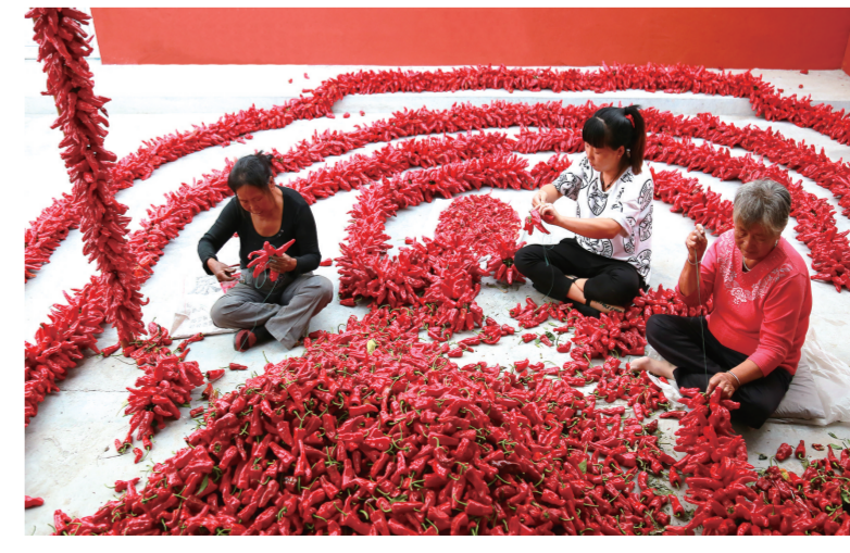
托克托县双河镇大羊场村集体经济喜获丰收,村民在辣椒烘干厂带红辣椒。