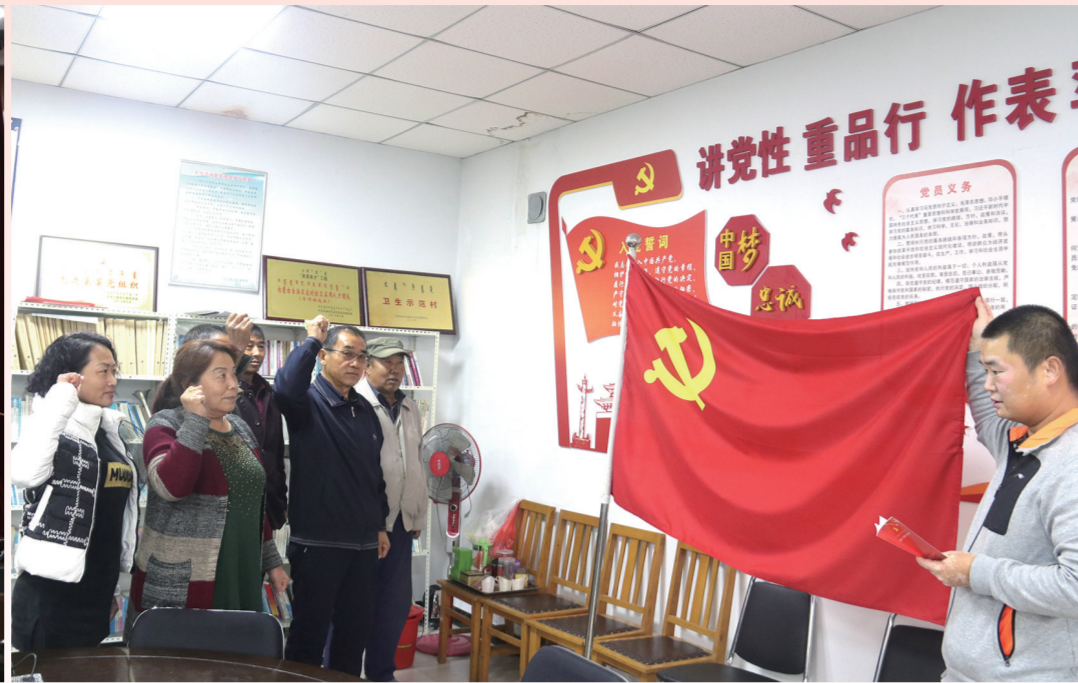
土左旗毕克齐镇大旗村党支部党员重温入党誓词。