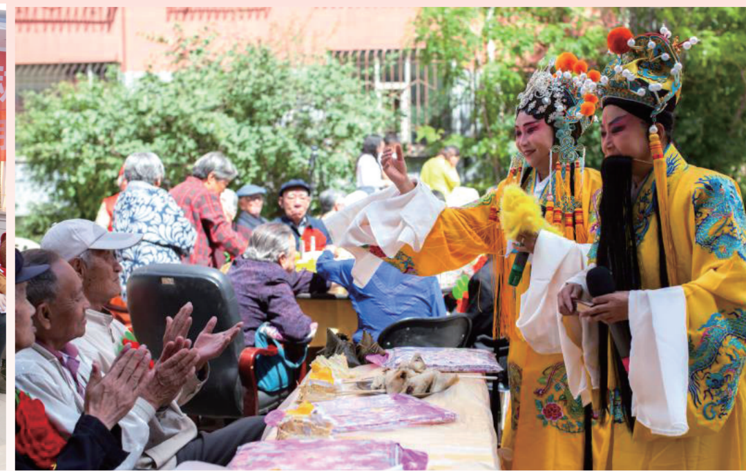
玉泉区兴隆巷街道清泉社区党委组织志愿者丰富居民文化生活。