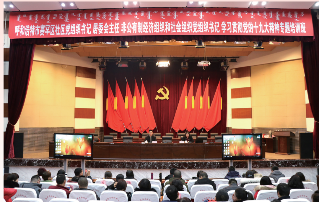
赛罕区早办社区党组织书记、居委会主任、非公有制经济组织和社会组织党组织书记专题培训班。