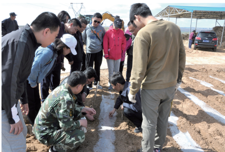
清水河县县村第一书记协调呼和浩特信访局干部指导帮助贫困户种植蔬菜。

发展壮大村集体经济是打赢脱贫攻坚战、促进乡村振兴的重要基础。托克托县因地制宜搭建村企共建“双赢桥”,促成大惠托电、久泰公司党委捐建黑水泉传统豆腐加工园,建设了储料车间、包装车间、冷库,年产值达1000余万元,解决就业70余人。目前一、二期工程已经完工,投资108万元的三期工程也已经开工建设,将新建加工车间13个,面积为900余平方米,给村集体带来了可观的经济收入。去年,通过“百村清零”,全县涌现出了北台基村红色教育基地、河口管委会稻田养蟹、小口村无矾粉条厂等一批集体经济示范项目。今年,争取上级集体经济项目资金500万元,以流转集体土地、兴办经营实体等形式新建项目8个,扩建项目3个。双河镇大羊场村辣椒烘干厂、柳林滩村金旺生猪养殖专业合作社、伍什家镇大北窑村农业机械服务中心等一批项目正式运营,为推动村级党组织有钱办事,带领村民增收致富注入了新的动力。