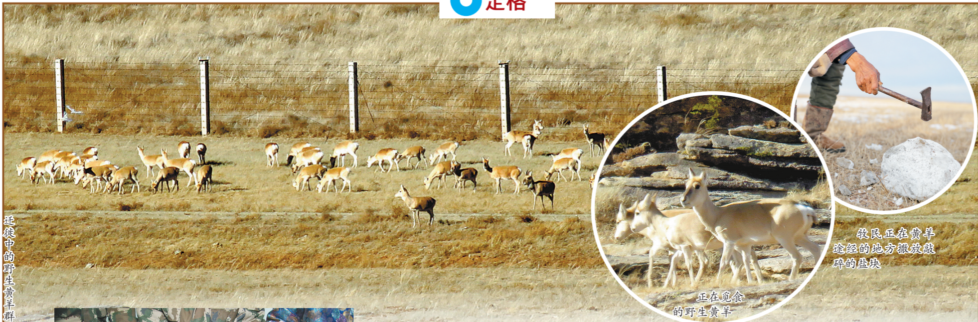
迁徙中的野生黄羊群