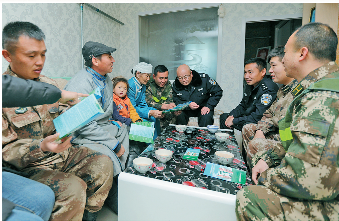
工作组到牧民家中开展野生动物保护宣传