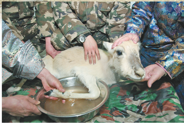
一只受伤的小黄羊 巡逻队发现并救助了