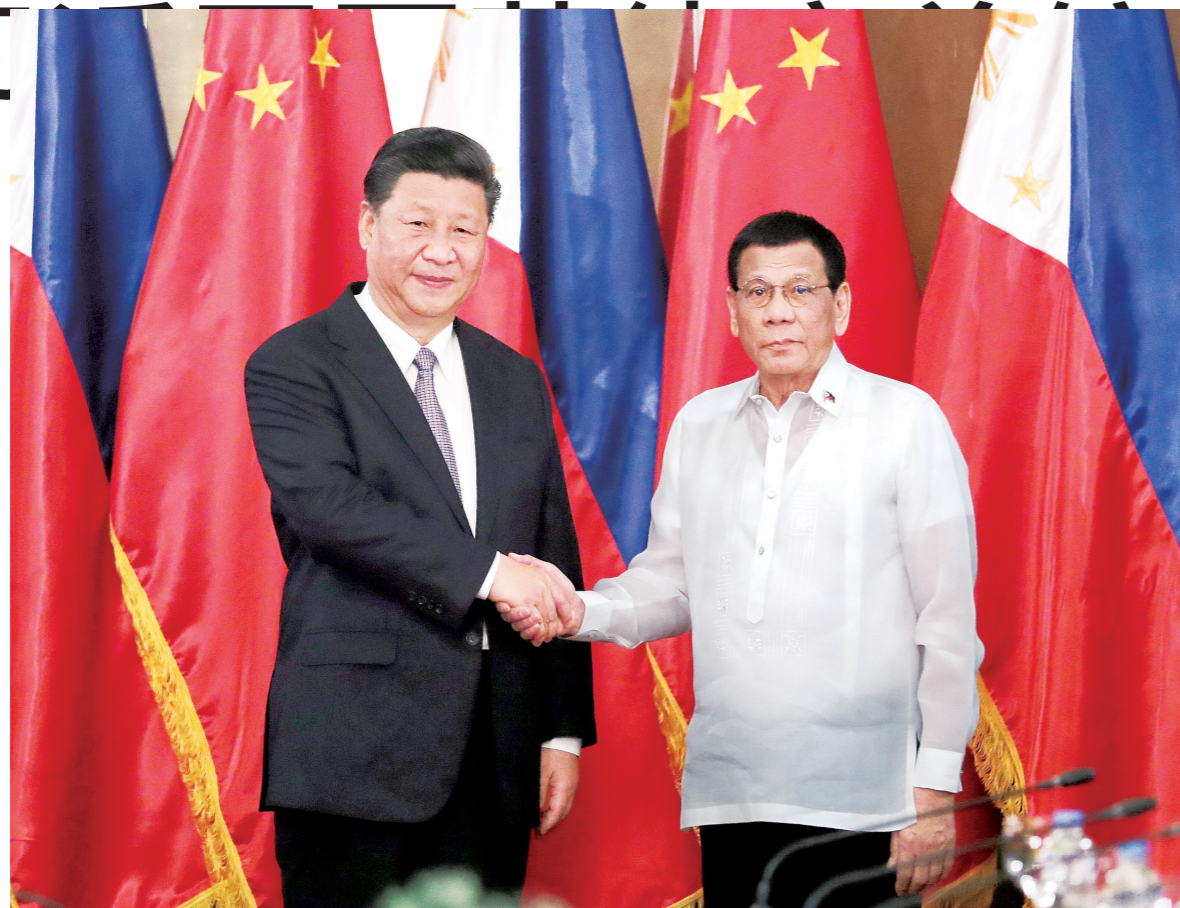
11月20日,国家主席习近平在马拉同菲律宾总统杜特尔特举行会谈。

内蒙古日报社出版 国内统一刊号:CN15-0002 邮发代号:15-1 今日12版