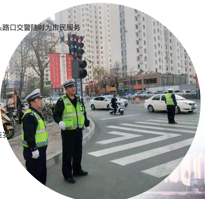
街头路口交警随时为民服务