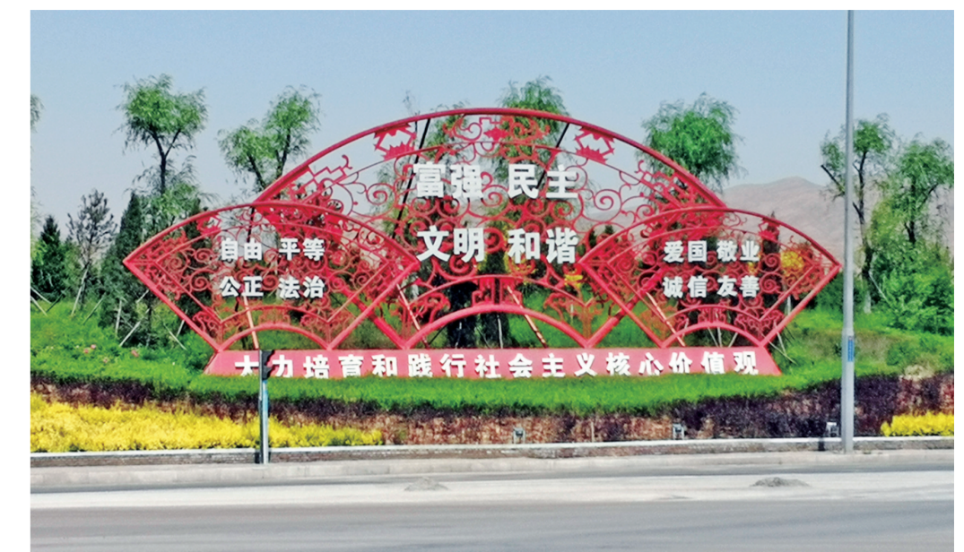
公益广告随处可见