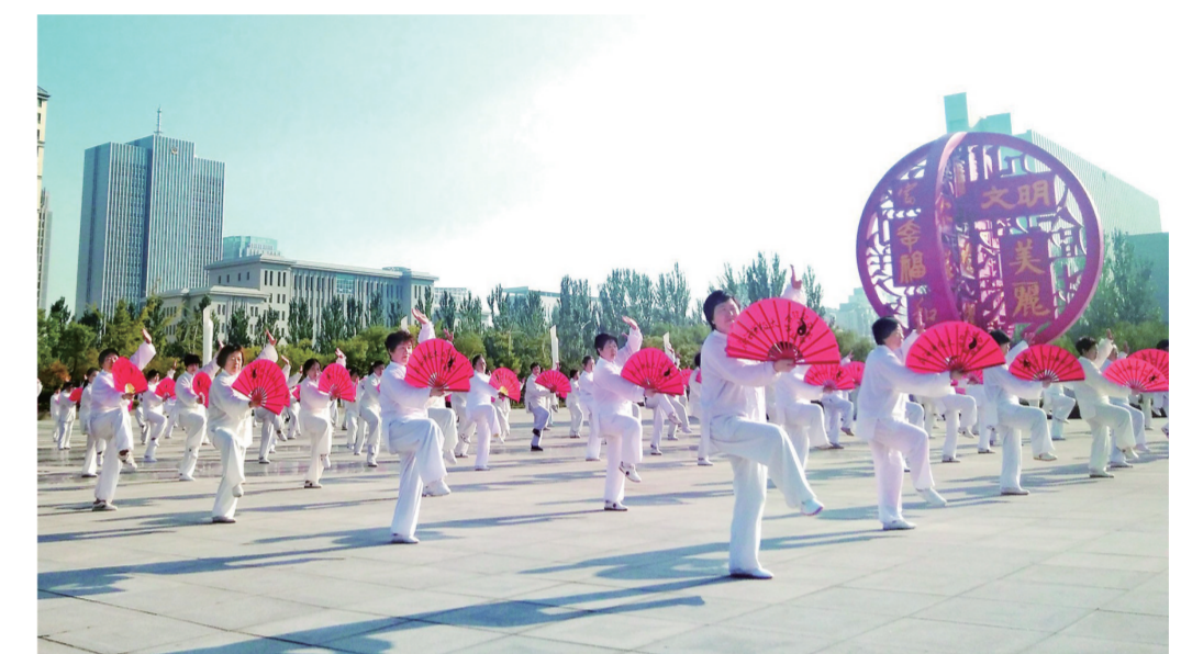
精彩的群众文艺活