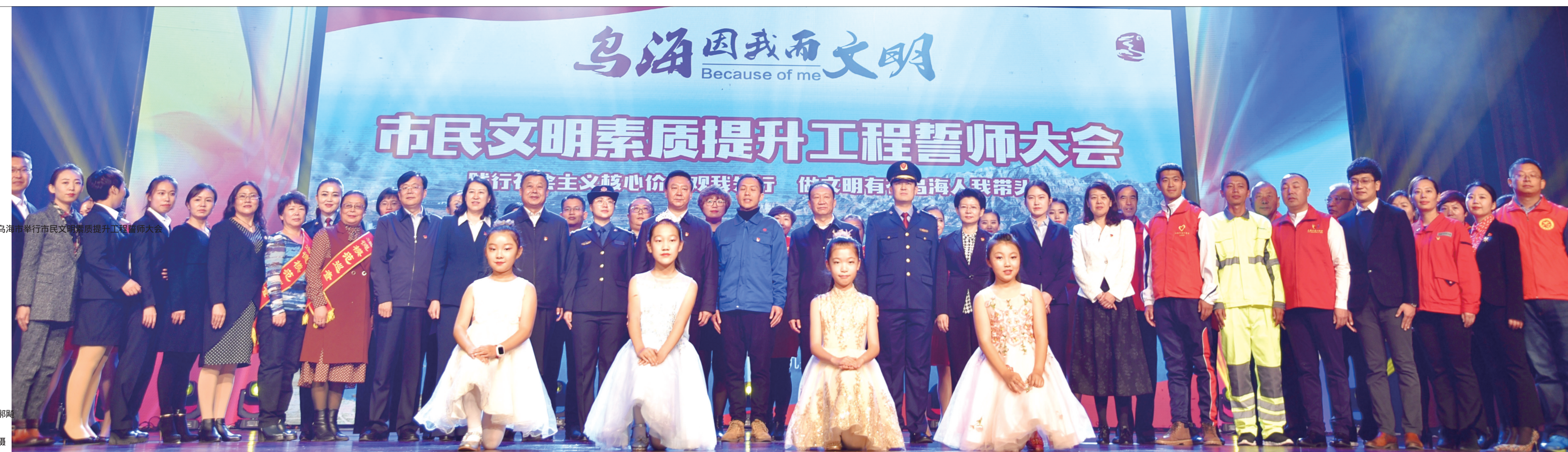
乌海市举行市民文明素质提升工程誓师大会