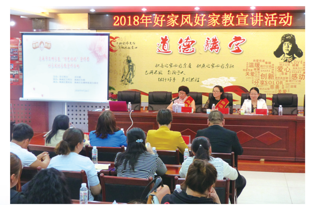
文明家风营造文明家庭。