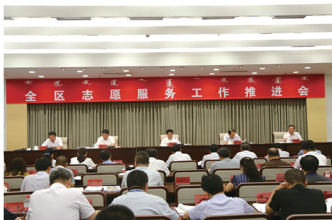
全区志愿服务工作推进会。