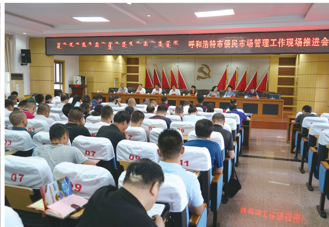
全市便民市场管理工作现场推进会。