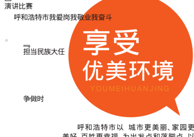
呼和浩特市举办演讲比赛