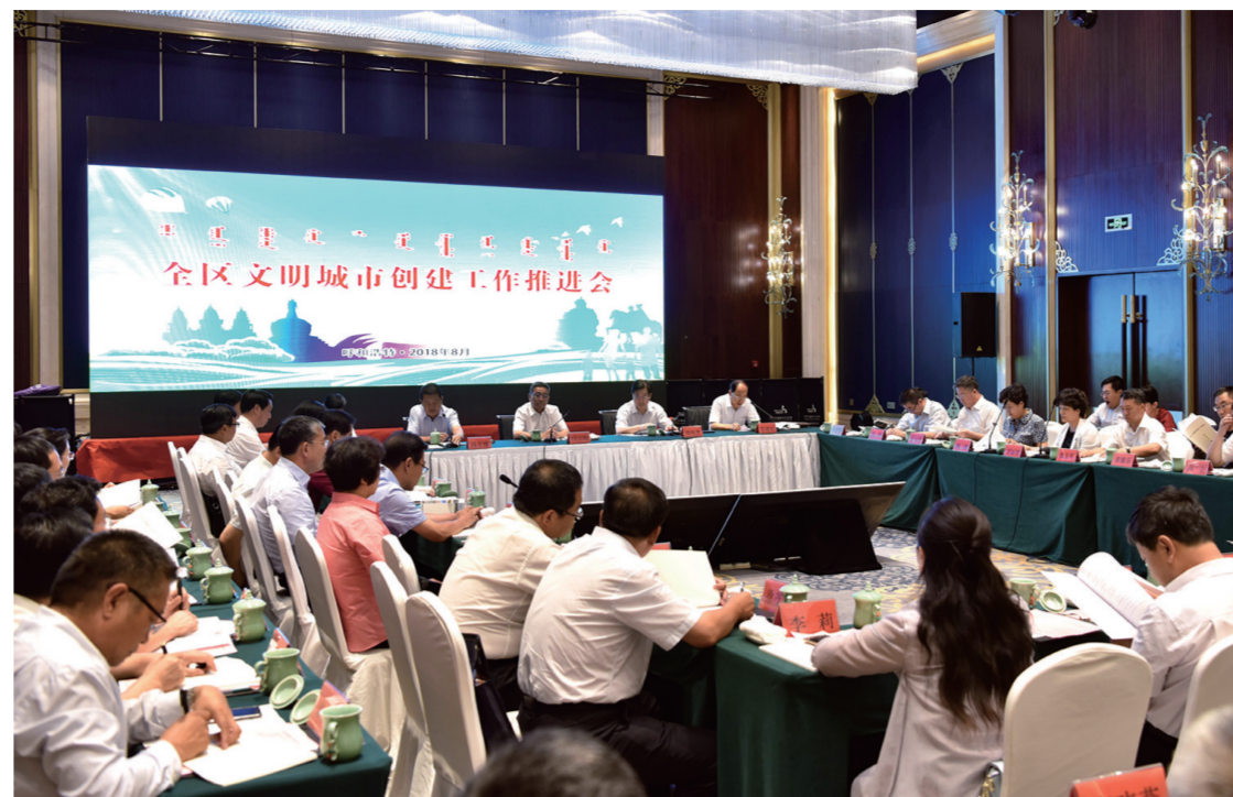
全区文明城市创建工作推进会。