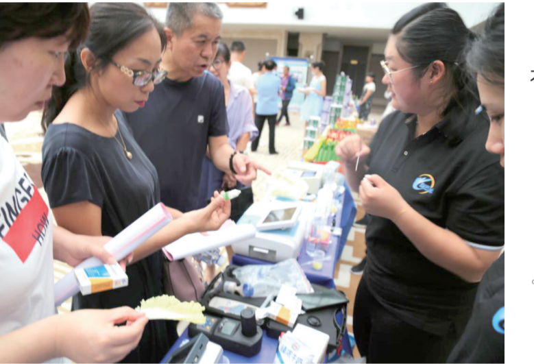
大力开展食品安全

保障食品和日常生活用水安全。全市3.5万家餐饮机构实现 明厨亮灶，餐饮业、集体食品食品质量安全量化分级管理率已经达到95%，近3年全市未发生重大食品安全事故。公共卫生与医疗服务日趋完善。全市适龄儿童免疫规划疫苗接种率达到了95%，实施了全民健康生活方式行动，推广减盐、控油等慢性病防控措施，完善了严重精神障碍防治管理网络，严重精神障碍患者管理率达到了75%以上。基层医疗卫生机构标准化建设达标率达到了95%，呼和浩特市近3年未发生重大实验室生物安全事故和因防控措施不力导致的甲、乙类传染病暴发流行。病媒生物预防控制更加严格。建立了政府组织与社会参与相结合的病媒生物防制机制，针对区域内危害严重的病媒生物种类，组织全市统一消杀鼠、蚊、蝇、蟑螂的密度达到国家病媒生物密度控制水平标准要求。文明让首府更美好，创建让市民更幸福。呼和浩特市将以饱满的热情和扎实的作风，精益求精地完成 三城同创 每一项任务，确保全国文明城市、国家卫生城市、国家食品安全示范城市如期创建成功。