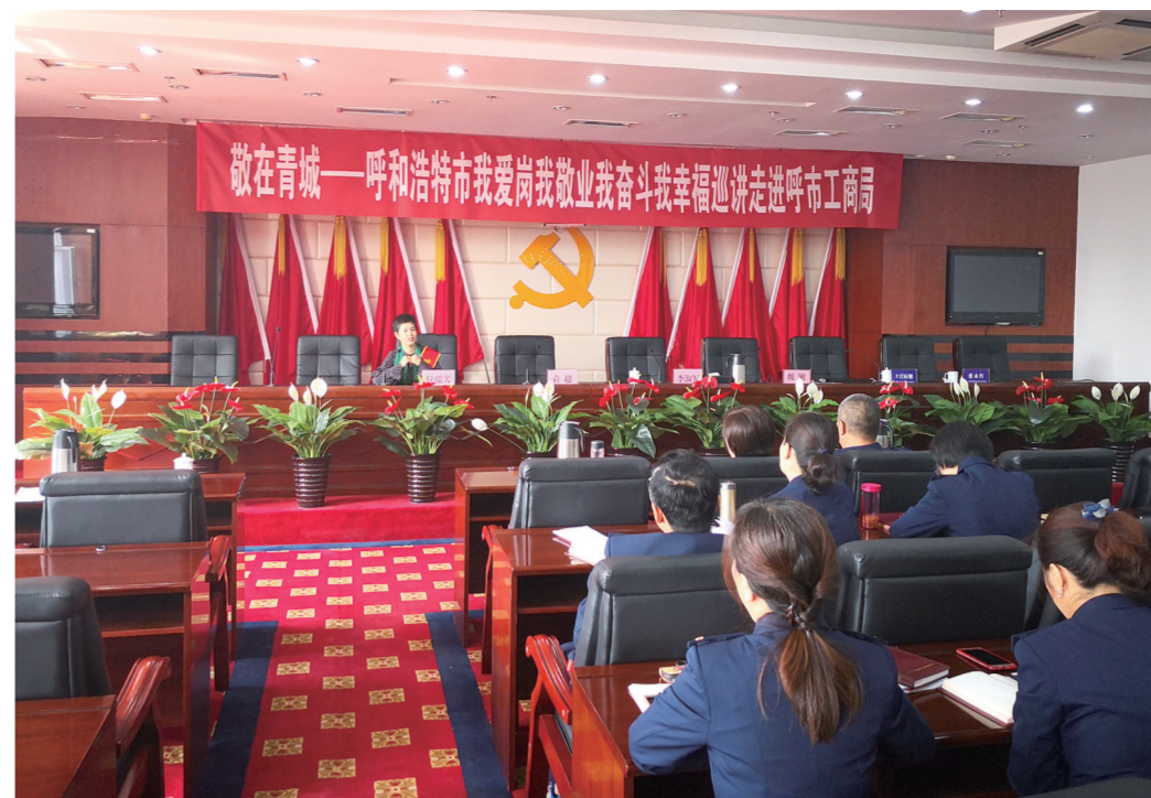
敬在青城 呼和浩特市我爱岗我敬业我奋斗我幸福 巡讲走进呼和浩特市工商局。