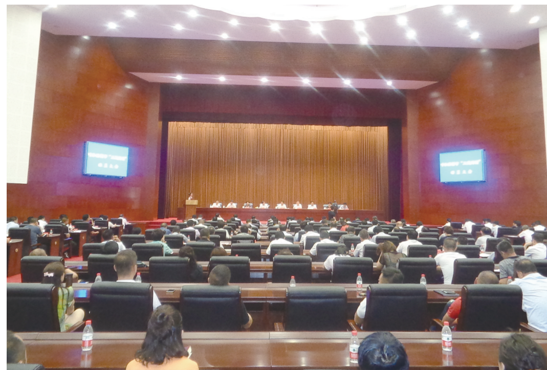
全市三城同创动员大会。