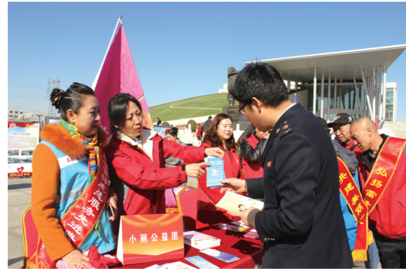
学雷锋志愿服务活动