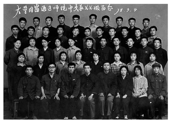
通辽师范学院中文系77级合影。