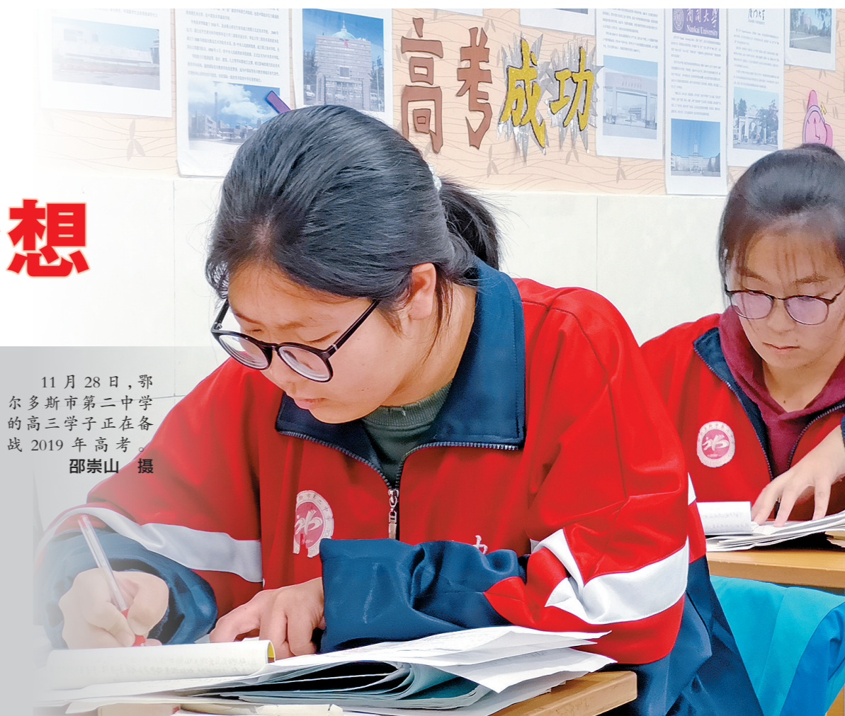
11月28日,鄂尔多斯市第二中学的高三学子正在备战2019年高考。