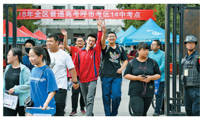
2018年6月8日,呼和浩特市十四中考点,考生走出考场。