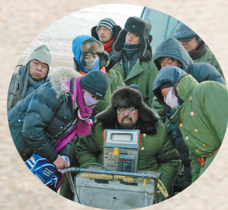
2009年,电视剧《大盛魁》拍摄现场