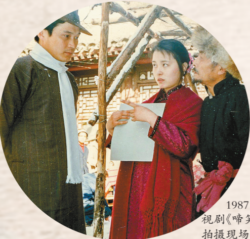
1987年,电视剧《啼笑因缘》拍摄现场