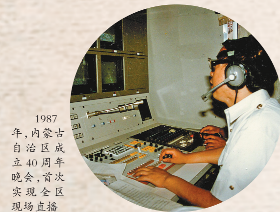
1987年,内蒙古自治区成立40周年晚会,首次实现全区现场直播