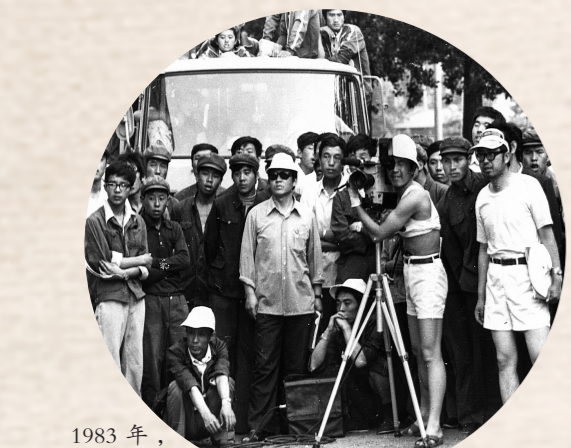
1983年,电视剧《小土屋的开拓者》拍摄现场