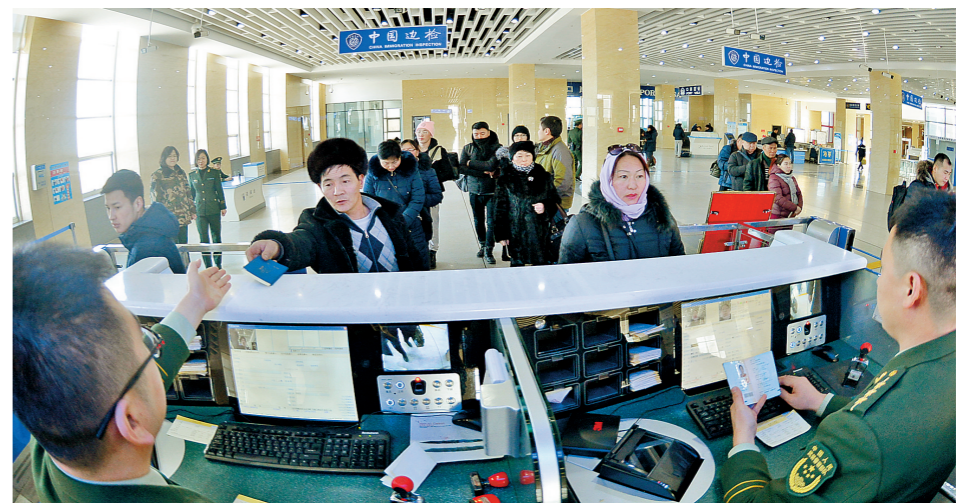
二连浩特海关为蒙古国旅客提供入境服务