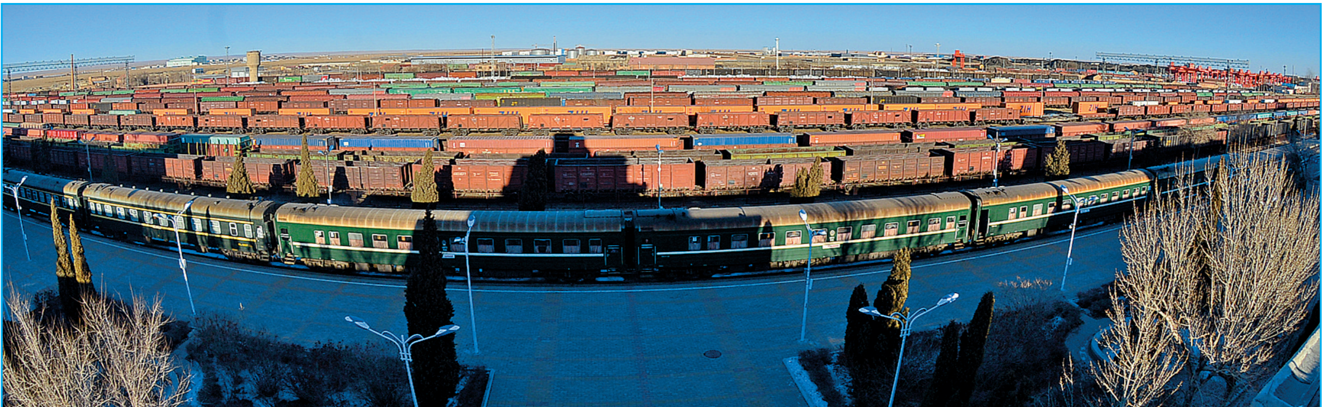
呼和浩特铁路局二连站宽轨作业现场俯瞰图