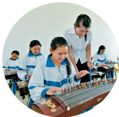
古国笙箫胜似建康中国古筝

从满大街的嘎斯69到一趟趟的中欧班列,广袤的草原沐浴着改革开放的春风,一个个不起眼的边陲小镇化身为一带一路建设中的一颗颗耀眼明珠,蜕变为一个冉冉升起的黄金口岸,为构建自治区北上南下、东进西出、内外联动、八面来风的对外开放新格局奠定坚实的基础。