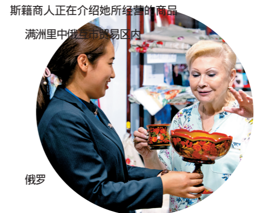
斯籍商人正在介绍她所经营的商品 满洲里中俄互市贸易区内