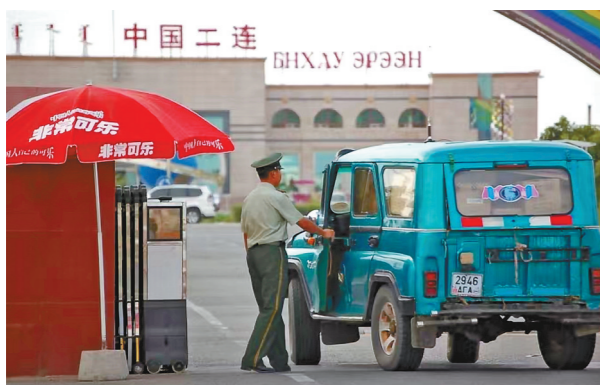
准备出境的俄罗斯集装箱 满洲里中俄互市贸易区内