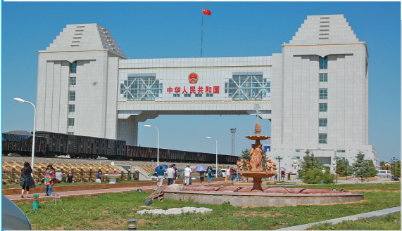
2007年的满洲里口岸 旅客搭乘俄罗斯列车贵宾室