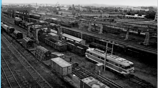
1989年,在出口货运量达三百万吨以上的满洲里火车站,货车换装车皮 (资料图)