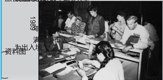
1989年 满洲里口岸 资料图