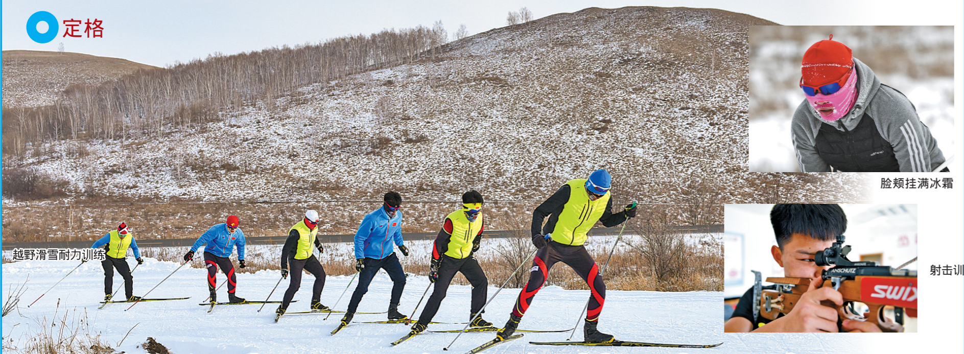
越野滑雪耐力训练