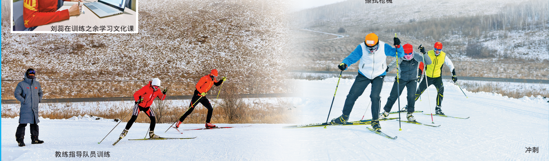
教练指导队员训练