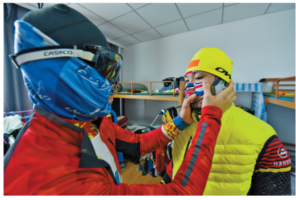
为队员贴上防冻贴