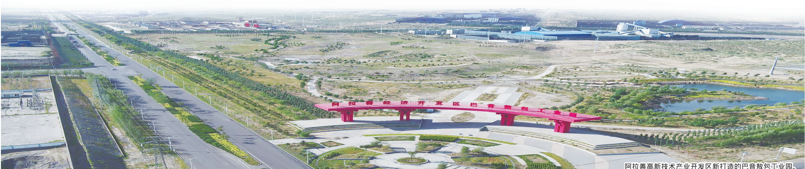
阿拉善高新技术产业开发区新打造的巴音敖包工业园。

高新区党委书记孔德贵说：我们园区有如此成绩得益于全面深化改革红利的持续释放，得益于驻区企业坚定信心、迎难而上、担当尽责、创新敬业的精神。站在新的历史起点上，我们将进一步丰富和完善行政审批服务、综合执法和服务园区长远发展的科技孵化、人才就业、金融服务、现代物流、综合配套、社会事业“2+6”营商平台，把推动高新区高质量发展放到全盟全区乃至全国大局中去思考和谋划，积极融入“一带一路”宏观战略布局，党政企同心，将阿拉善高新区建设成自治区精细化工创新基地、创建国家级高新技术产业园区，早日跻身自治区千亿元园区行列，为打造祖国北疆亮丽风景线助力添彩。