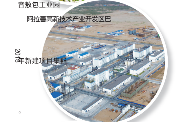
阿拉善高新技术产业开发区巴