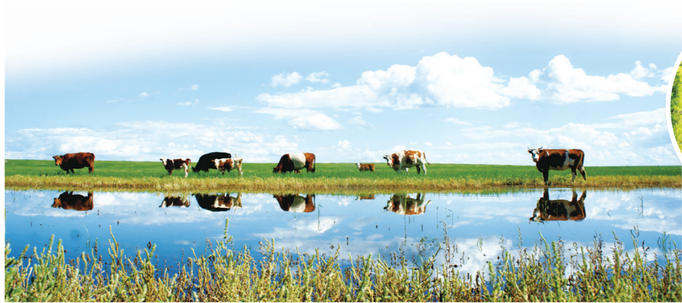
绿草碧水让草原焕发新机。