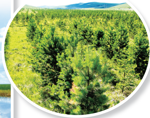
生态建设效果显著。