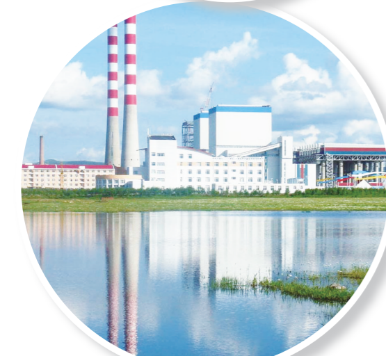
工业文明与草原结合处的生态美景。