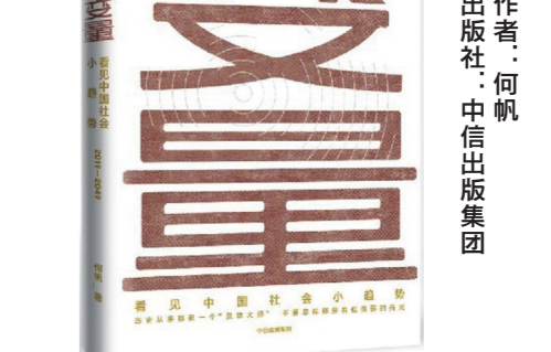
作者：何帆 出版社：中信出版集团