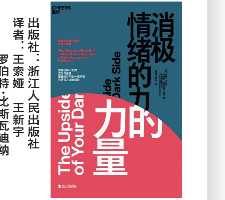
作者：罗伯特·比斯瓦迪纳 译者：王素媛 王新宇 出版社：浙江人民出版社