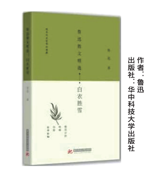
作者：鲁迅 出版社：华中科技大学出版社