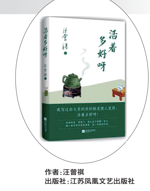
作者：汪曾祺 出版社：江苏凤凰文艺出版社