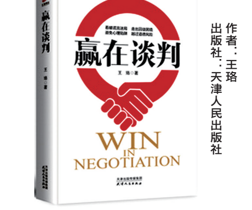
作者：王珞 出版社：天津人民出版社