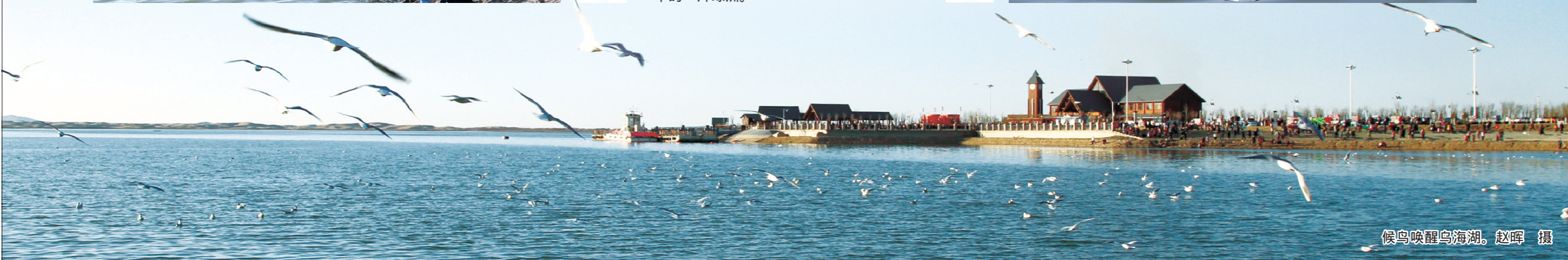
候鸟唤醒乌海湖。