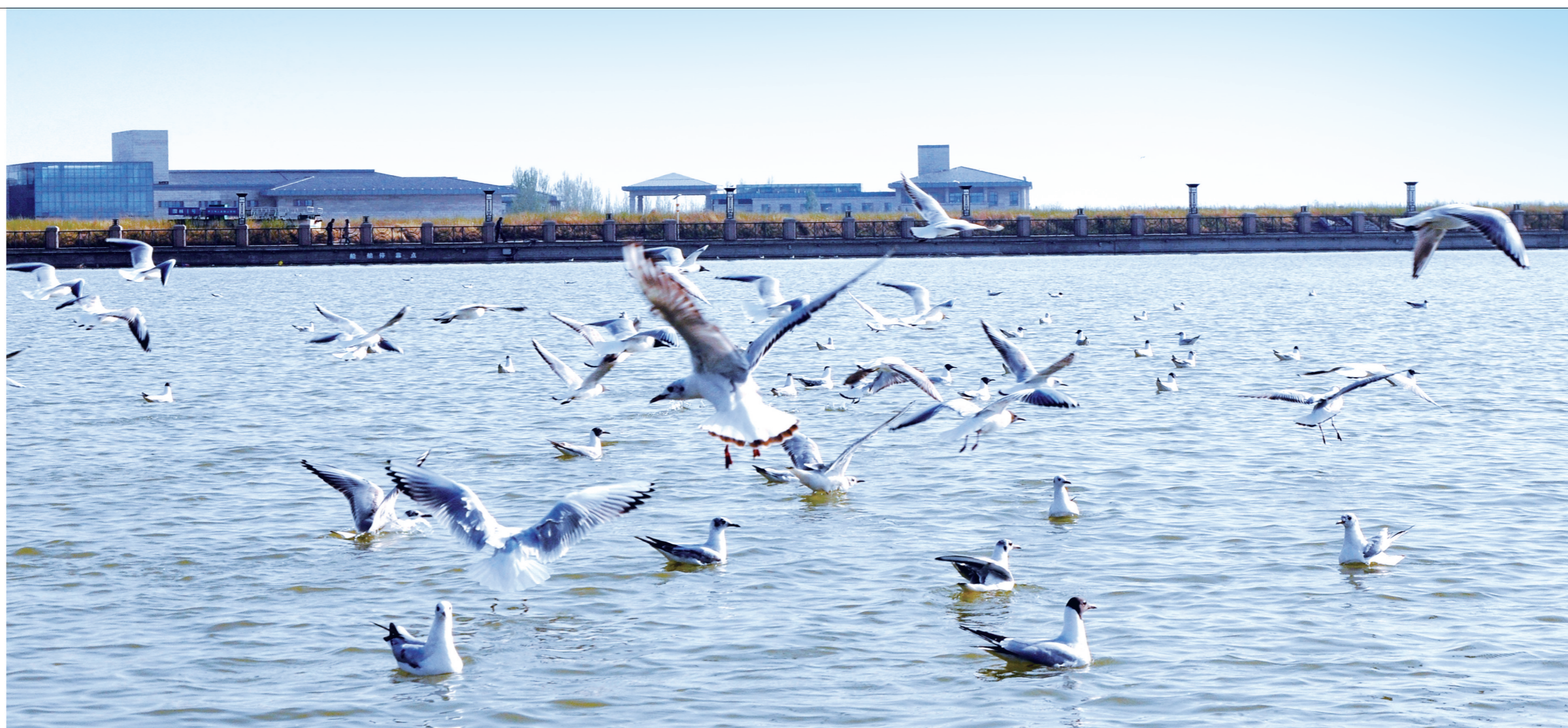
嬉戏觅食的红嘴鸥