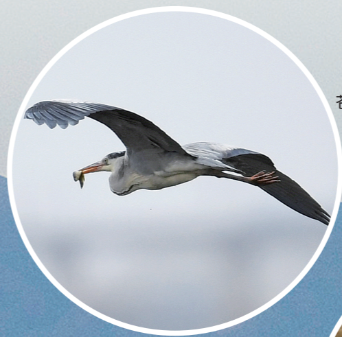
苍鹭捕鱼