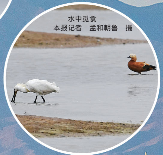
水中觅食