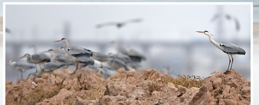
傲视群雄