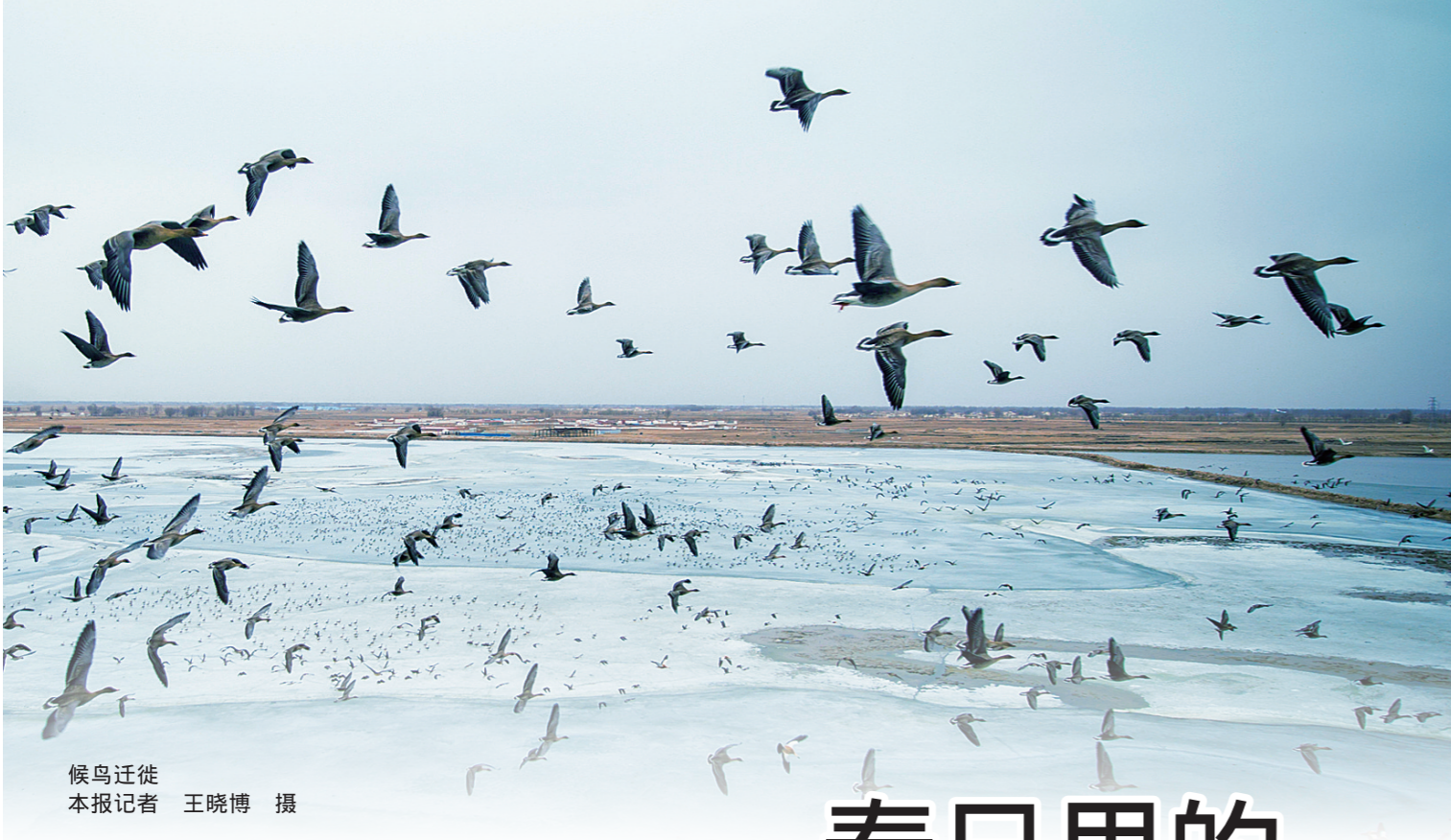
候鸟迁徙