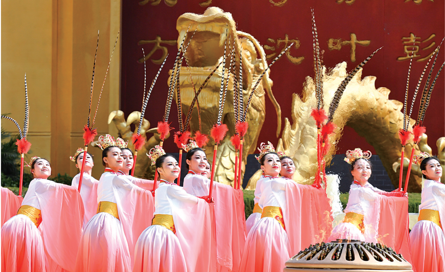
己亥年 黄帝故里 拜祖大典 在郑州举行

4月7日,演员在己亥年黄帝故里拜祖大典上表演。当日,己亥年黄帝故里拜祖大典典礼在郑州举行,来自40多个国家和地区的近万华人代表出席。