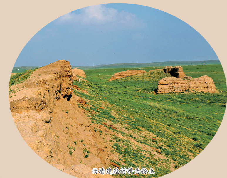
西墙建造材料为粉土