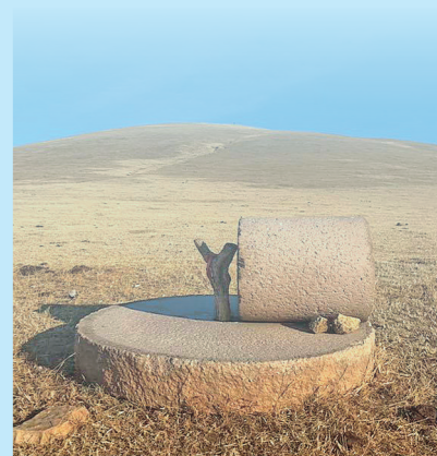
石磨居于安静的山野上