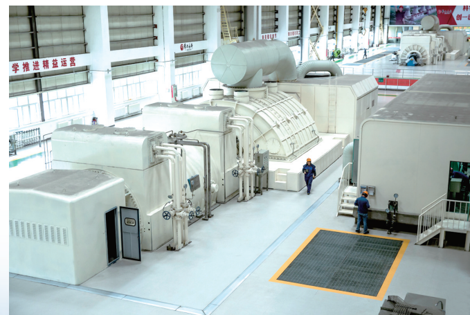
鄂尔多斯电力三公司电力机组。