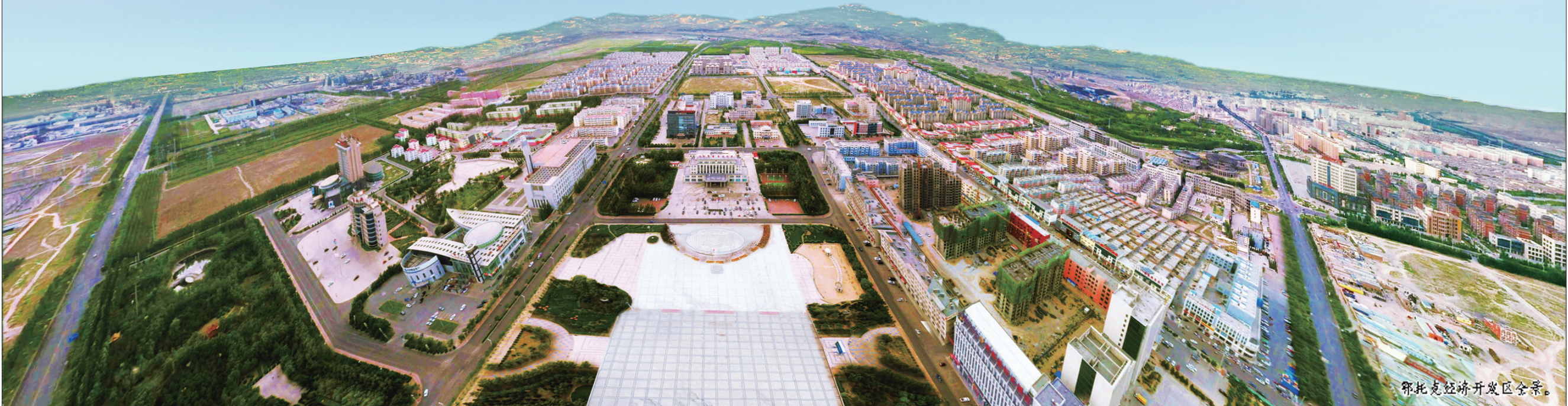
鄂托克经济开发区全景。