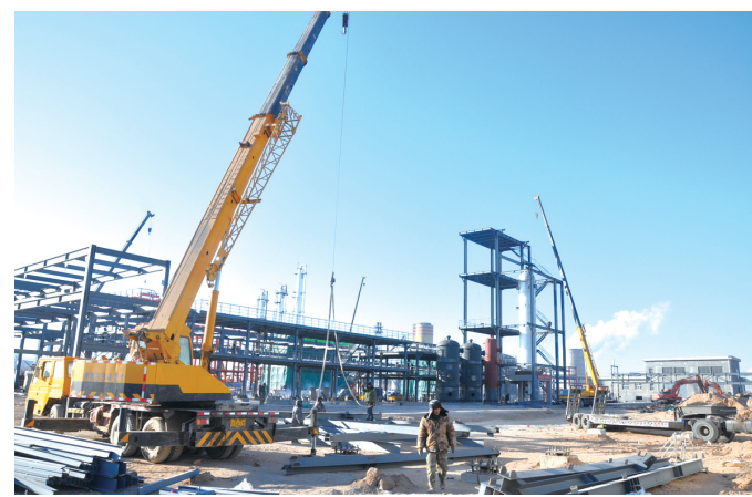
瀚博科技有限公司矿热炉尾气综合利用制12万吨甲醇项目施工现场。

斯琴毕力格强调,为使重大项目顺利推进,抓项目建设,一定要在深刻领会中央新精神、新要求上下功夫,始终坚持在生态环保、绿色安全的前提下上项目、搞建设、谋发展,积极探索以生态优先、绿色发展为导向的高质量发展新路子;抓招商引资,一定要在项目的策划包装和沟通协调上下功夫,紧密结合全市高质量发展规划以及产业布局,引进一批延链、补链、强链的好项目、大项目;抓项目推进落实,一定要在发现问题、解决问题上下功夫,及时发现解决项目审批、建设中的各类问题,保证重大项目顺利推进,确保固定资产投资处在合理区间,推动经济稳中有进、稳中提质。