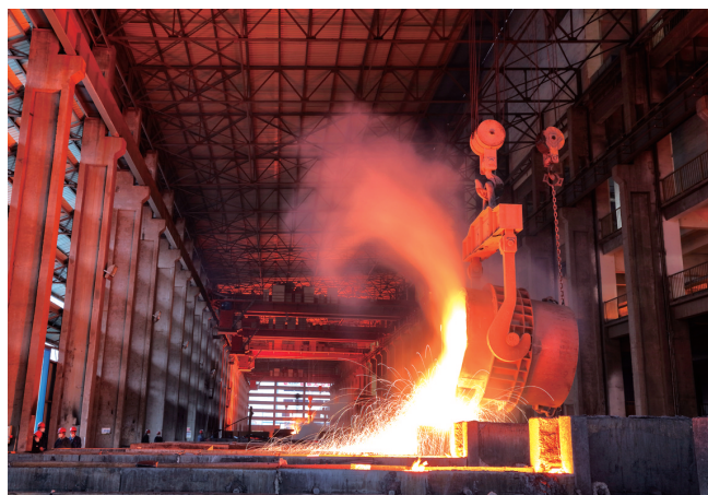
硅铁浇筑生产车间。