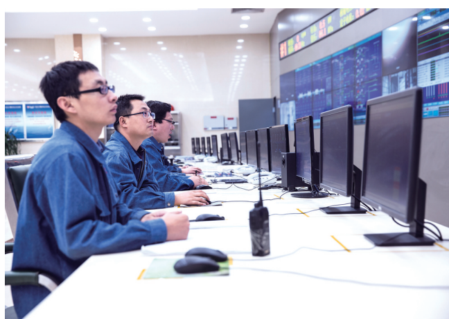
鄂尔多斯电力三公司中控室

4月9日,鄂尔多斯市重大项目推进现场会在鄂托克旗召开。鄂尔多斯市四大班子领导及各旗区委政府主要负责人参加会议,与会人员深入鄂托克经济开发区部分项目建设一线进行了现场观摩。此次全市重大项目推进现场会在鄂托克旗举行,是鄂尔多斯市聚焦新旧动能转换,聚力推进高质量发展,扎实做好经济运行、产业转型、污染防治、安全生产等重点工作,集中打造全市首个“千亿级”工业园区的实践活动。近年来,鄂尔多斯市各旗区各部门在抓项目、促投资方面做了大量卓有成效的工作,但与新形势、新任务、新要求相比,还存在一些堵点、痛点和难点。面对严峻的经济形势、发展大势和竞争态势,全市上下牢固树立“不进则退、慢进也是退”的理念,实实在在抓了一批大项目、好项目,培育一批增长点、支撑点、发力点,坚决打赢项目建设这场翻身仗,为推动全市经济高质量发展提供有力支撑、注入强劲动力。