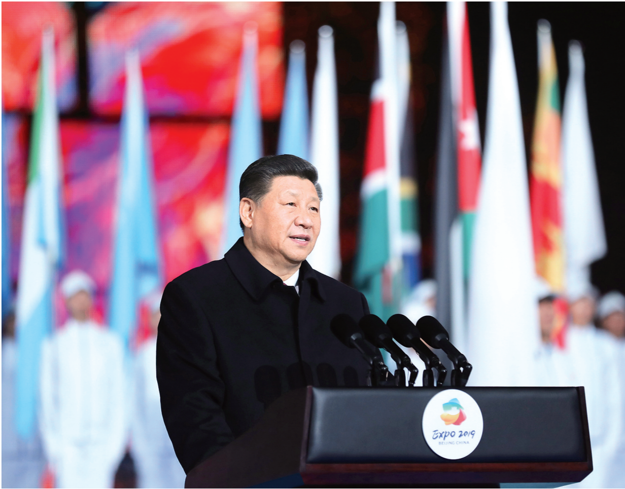
4月28日,国家主席习近平在北京延庆出席2019年中国北京世界园艺博览会开幕式,并发表题为《共谋绿色生活,共建美丽家园》的重要讲话。