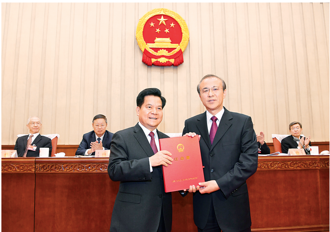
5月31日下午,自治区党委书记、人大常委会主任李纪恒出席自治区十三届人大常委会第十三次会议第三次全体会议,并为新任命的自治区副主席郑范颁发任命书。

会议表决通过了《内蒙古自治区人民代表大会常务委员会议事规则》的决定,表决通过了《内蒙古自治区人民代表大会常务委员会议事规则》的决定,表决通过了《内蒙古自治区人民代表大会常务委员会议事规则》的决定,表决通过了《内蒙古自治区人民代表大会常务委员会议事规则》的决定。