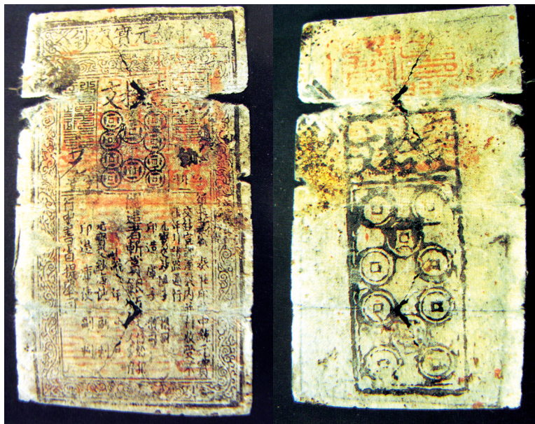
“壹拾文中统元宝交钞”正面。