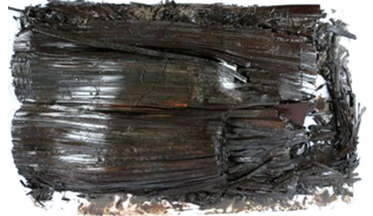
荆州胡家草场墓地M12出土的西汉简牍。