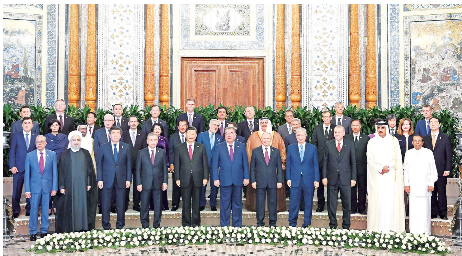
6月15日,亚洲相互协作与信任措施会议第五次峰会在塔吉克斯坦首都杜尚别举行。国家主席习近平出席峰会并发表重要讲话。这是出席会议的亚信成员国领导人或代表、观察员国代表以及有关国际和地区组织代表集体合影。

新华社杜尚别6月15日电(记者范伟国 骆璐 郝方甲)亚洲相互协作与信任措施会议第五次峰会15日在塔吉克斯坦首都杜尚别举行。国家主席习近平出席峰会并发表重要讲话,强调要建设互敬互信、安全稳定、发展繁荣、开放包容、合作创新的亚洲。中国将坚定走和平发展道路,坚持开放共赢,坚定践行多边主义,同各方共同创造亚洲和世界的美好未来。当地时间上午,习近平抵达纳乌鲁兹宫迎宾馆,受到塔吉克斯坦总统拉赫蒙热情迎接。